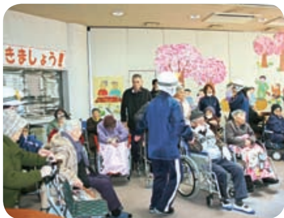
施設の避難訓練 (清寿園)

池田市長 ニチレイと清水建設とは、発注者と受注者の関係にあり、両者とも現在協力し合っている。また当日、14時15分頃、警察より小倉自治会方面の避難呼びかけ要請があり、緊急に避難所の手配をし、23世帯の39名が避難された。