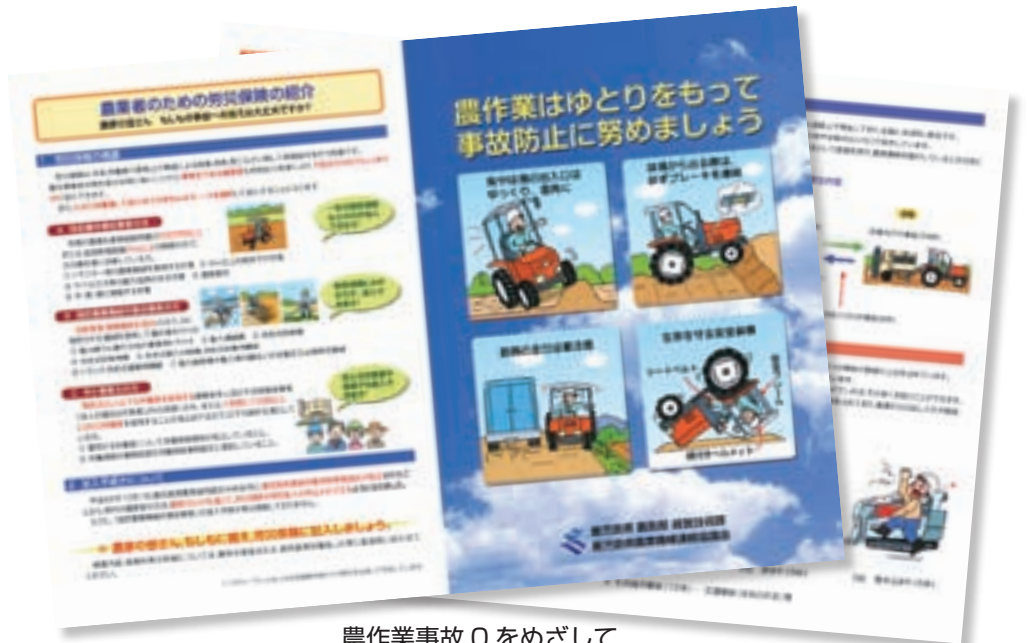
農作業事故0をめざして

市長 毎年4月、10月を農作業事故0運動期間とし、自治会使送便によるパンフレット配布や有線放送での防止呼びかけ、県立農業大学との共催での安全講習もある。また各種場合でも安全対策につい