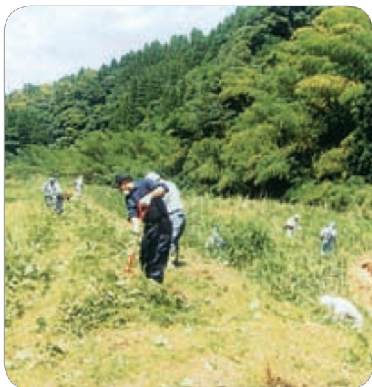
八ヶ代自治会と建設同志会によるボランティア作業（財部町）

おり、災害査定においてもその点が厳しく指摘される所である。また、早急な復旧を必要とすることから現行法に従い、速やかな実施に努めている。災害の原因となる箇所等については改修が必要であり、国・県に強く要望している。未然に災害を防止する対策として、シラス対策事業や特殊農地保全対策事業等、災害を回避する施策の充実についても国や県に要望していく。