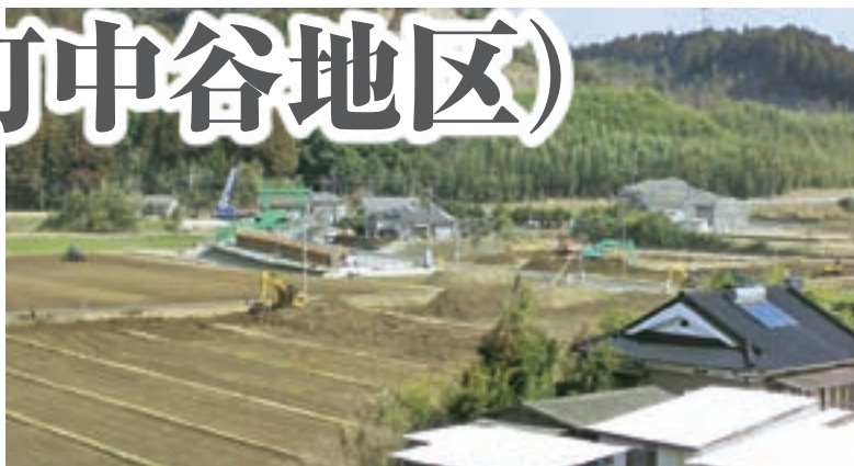
災害復旧工事状況 (3月)