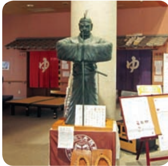
弥五郎の湯でくつろぎを