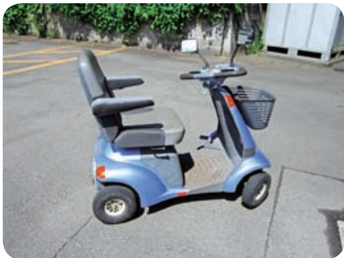
利用が増えている電動カー

いため、市内の普及率は低く購入補助については現在考えていない。高齢者の電動カーについては、日常的に歩行困難で電動カーがないと日常生活ができない方を対象に、福祉用具貸与として利用していただいている。今のところ購入補助については考えていない。