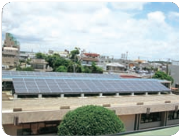
環境にやさしい太陽光パネル (曾於市役所)

市長 通信業者の自主開局は一部でも出来ないうかが要望してきた。結果は国の予算はまだだが、通信業者の一部開局(末吉局と大隅局)