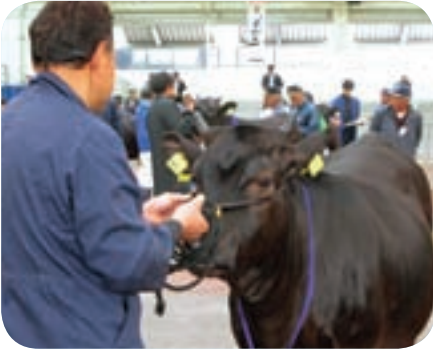
曾於地区春季畜産共進会 (大隅町八合原)

平成23年度曾於市春季畜産品評会が旧町ごとに開催され、それぞれの部門から12頭ずつ、曾於市代表として36頭が平成23年4月15日の曾於地区春季畜産共進会に出品された。曾於地区内より96頭の肉用牛で、午前中に各部門全頭の測尺、個体審査、4部については個体審査