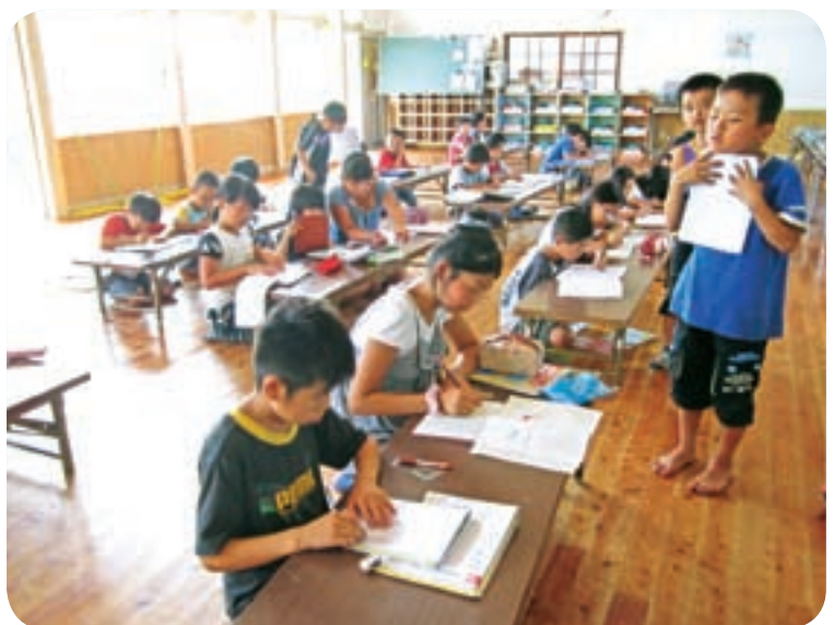
公民館運営による諏訪児童クラブ