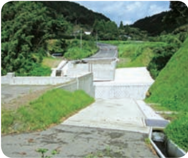
大隅町恒吉辺地(上須田木橋)