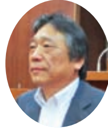
五位塚 剛 議員