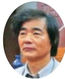
徳峰 一成 議員