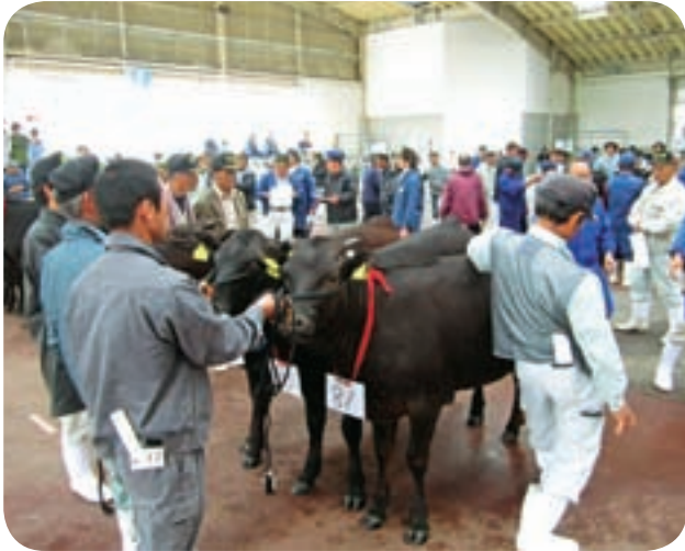
生産技術向上と改良増殖を図る品評会

池田市長 平成23年1月1日現在、肉用牛は1581戸で1万3881頭、肥育牛は68戸で1万2807頭、繁殖豚61戸で1万8612