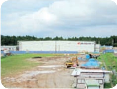
産業振興が期待される保冷库

問 市との人件費の予 算は10人で2506万円 である。実際の人件費と 人数は。