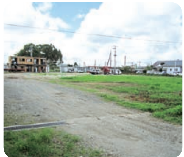
消防センター建設予定地(大隅町東桜ヶ丘)