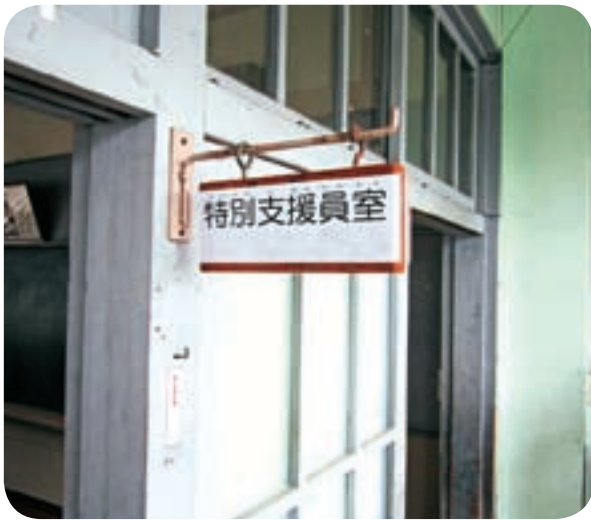
特別支援教育の充実を図ります

答 災害発生時などに障害者や要介護者、及びひとり暮らしの高齢者等援護が必要な方々を把握し、迅速かつ確実に情報伝達を行う体制づくりのため導入されるもので、要援護者台帳等をもとに非常時の安否確認までの業務をトータル的にサポートするシステムである。