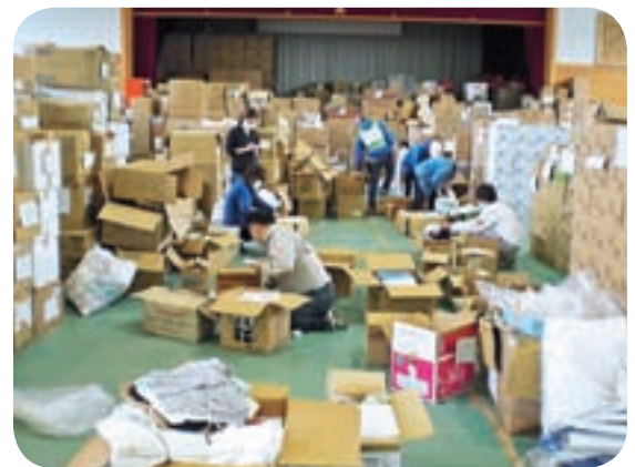
職員による支援活動（岩手県大船渡市）

市長 大隅半島の4市 5町で復興チームをつく り人的支援や物資の支 援をしている。