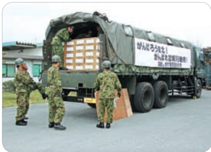
石巻市と大船渡市へ送られた「ゆず吉くん」28,000本

市長 3月22日に鹿児島県大隅半島4市5町で復興チームを設立した。復興チームは、大船渡市に現地支援本部2名を置き4市5町で9名を派遣しており、現場の指示により活動を行なっている。被災地の石巻市と大