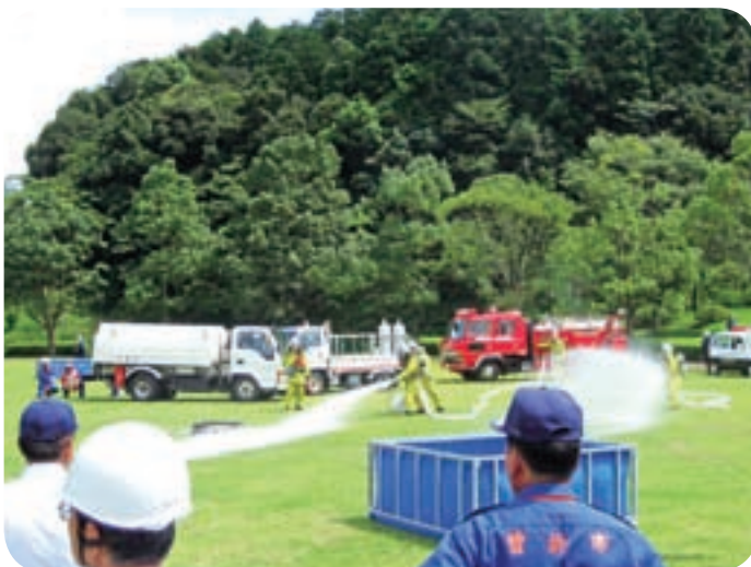
災害に備えて防災訓練