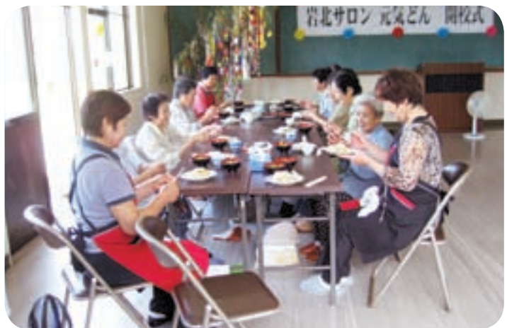
楽しく食事をとりながらふれあう岩北サロン元気どん

問 さらに、見守りや声かけが弱い。根本問題は、市の予算はゼロ計上で社会福祉協議会に丸投げして市が責任を果たしていない点にあるのではないか。