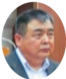
海野 隆平 議員