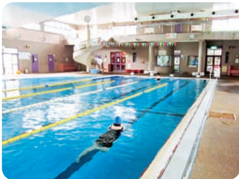
健康増進が期待される市民プール

市長 地域ボランティアの活動内容も様々であり、色々貢献してもらっている。今後さらに連携を図りながら取り組んでいく。