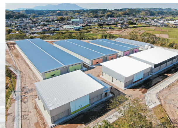
▲ 産業動物モデル飼育エリアの全景