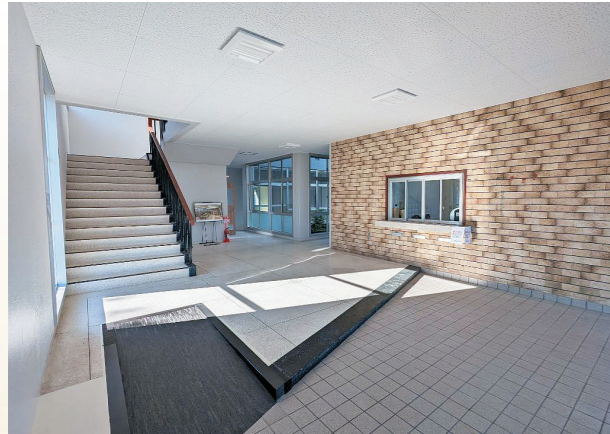
▲ 一部元の姿を残した玄関