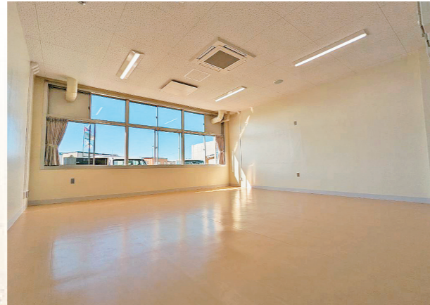
▲ 誰でも使える会議室