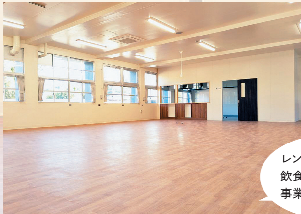
▲ 色々な方が集えるカフェ飲食スペース