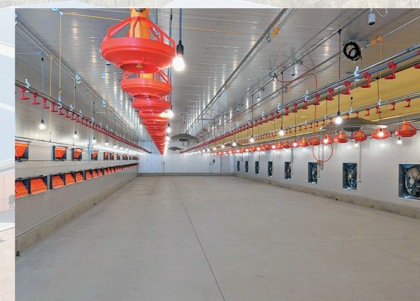
▲ 鹿児島大学研究用の鶏舎

南九州畜産獣医学拠点事業をはじめ市の地方創生プロジェクトに企業版ふるさと納税で支援していただいた企業（申出順）