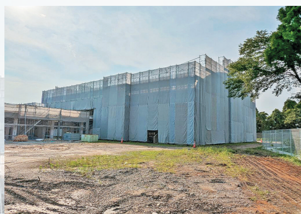
▲ 改修中の屋内馬場