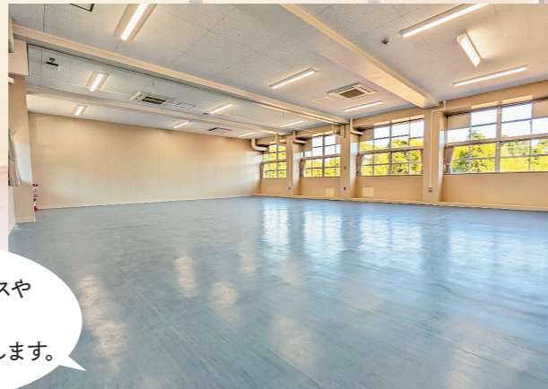
▲ レンタルオフィス