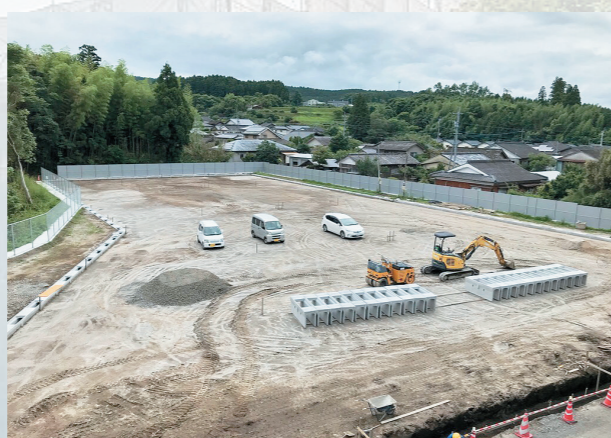
▲ 工事中の屋外馬場