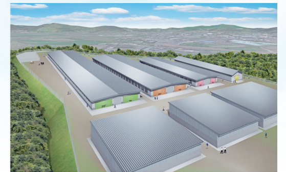
▲ 産業動物モデル飼育エリアの完成予想図