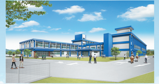
▲ 地方創生エリアの完成予想図