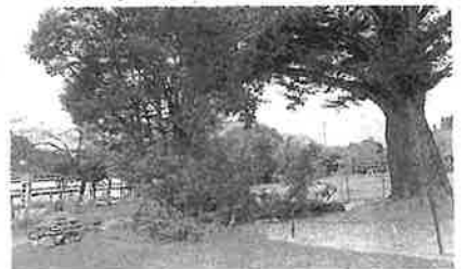
事故があったイチヨウの木と折れた枝。県内の学校でこうした危険な樹木の点検が進められている。8月9日、曾於市の高岡小学校

学校が157校。うち28校は枝切りや伐採を済ませた。残りの学校は応急処置や立ち入り禁止の対応をとっているという。