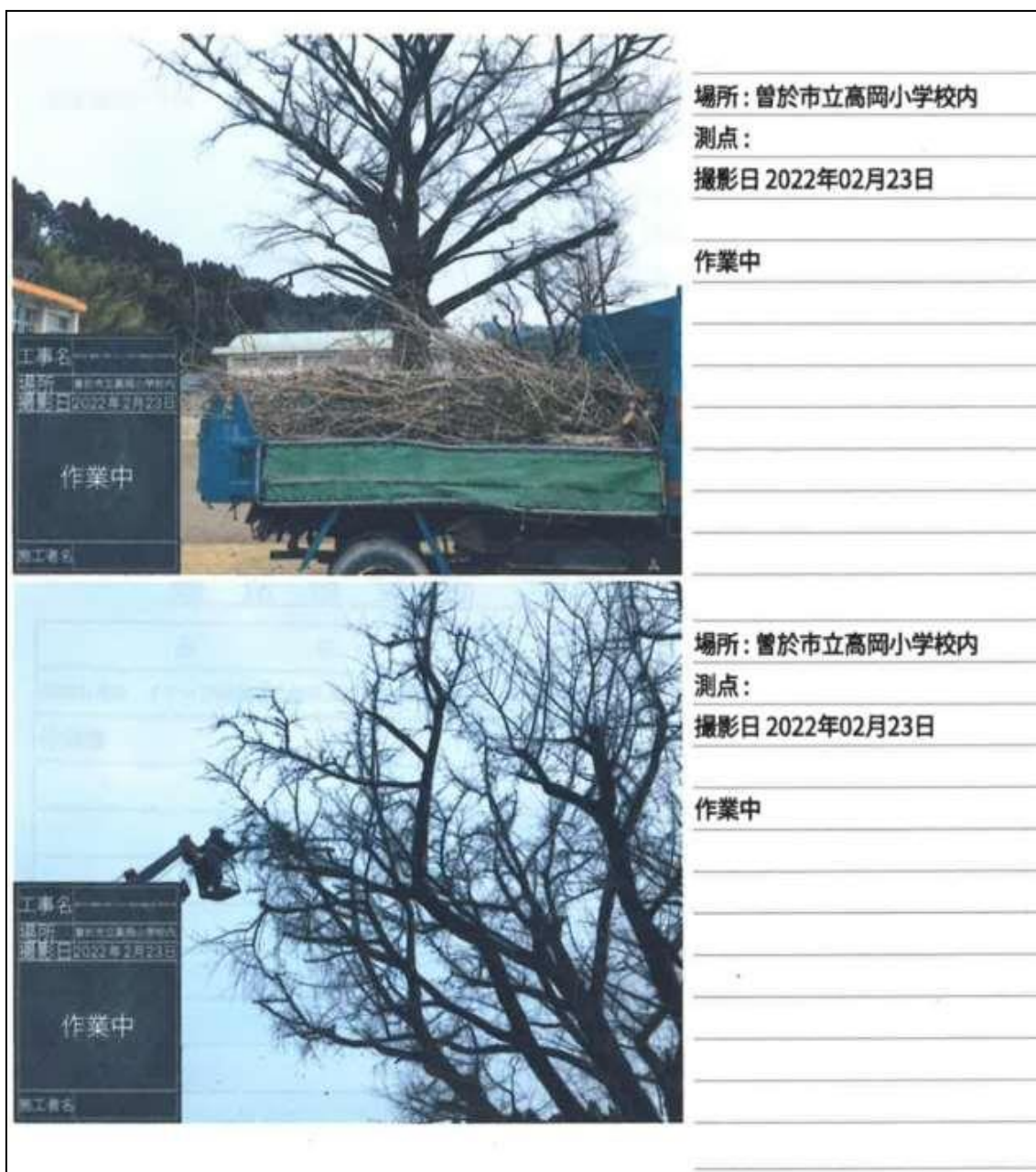
【写真4】 令和4年2月23日高岡小学校樹木伐採作業