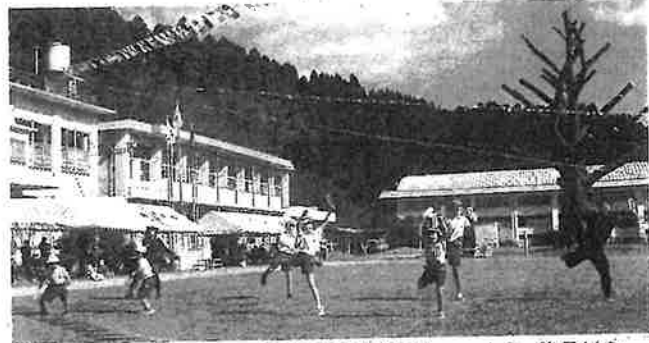
前校長に届けとの願いを込めて演技する児童ら。後ろはシンボルのイチヨウ