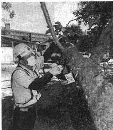
枯れ木を伐採する業者＝8月31日、鹿児島市の明和小学校

4校の内訳は市町村立校が157、県立校が37。枝切りや伐採を終えたのは市町村立校で26、県立校が2。8月末までに報告がなかったのは霧島、南九州の両市。霧島市には小中高48校、南九州市は小中20校があり、いずれも専門家が調査中。各市教委は「点検終了