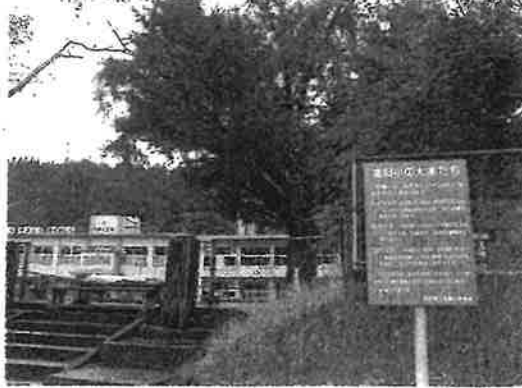
正門の前に立つ「高岡小の大木たち」の看板。後方は枝が折れた大イチョウ ＝曾於市末吉町南之郷

曾於市の高岡小学校で9日、木の下で 芝刈りしていた校長(57)が折れた枝の下 敷きになり死亡した事故を受け、鹿児島 県内の学校は樹木管理に苦慮している。 県教育委員会は校内の点検を求めたが、 樹木が法的な点検対象になつておらず再 発の懸念は残る。伐採しようとするれば、 地域のシンボルを守りたいという住民の 反発を招く恐れも。2学期を控え、校内 の安全確保のあり方が問われている。