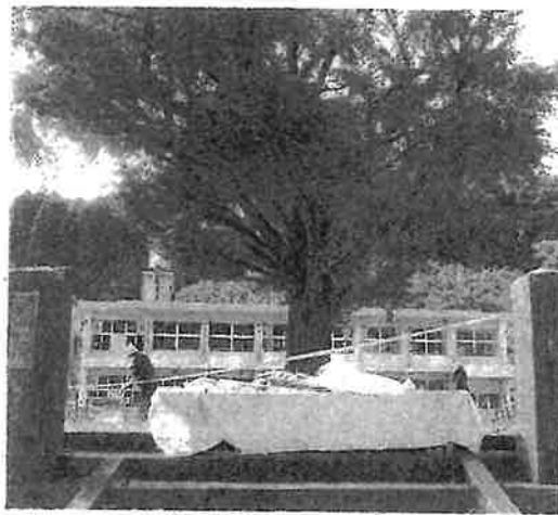
校長の死を悼み、正門に設置された献花台 ＝10日、曾於市末吉町南之郷の高岡小学校

曾於市末吉町南之郷の高ヨウの枝の下敷きになり校 岡小学校で、折れた大イチ長が死亡した事故で、市教