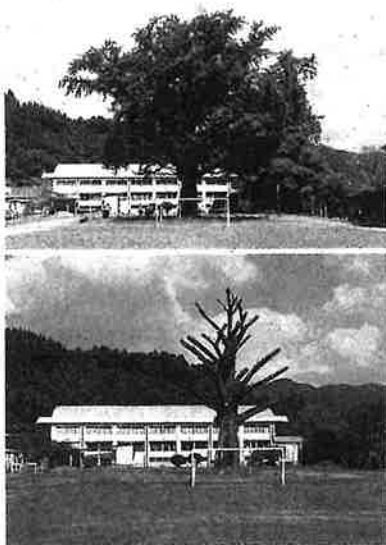
●校切り前のイチヨウ ●校切りを終えたイチヨウ

曾於市末吉町南之郷のしいとの声が拳がり、遺族も保存を希望している高岡小学校で、校長が折れたイチヨウの枝の下敷きになってしまった事故を受け、市教育委員会は再発防止のため約20本の枝を剪定した。 曾於市教委は、管理の在り方を樹木医や地区公民館と協議。自治会長の大数から、学校のシンボルのイチヨウを残してほ しいとの声も、遺族も保存を希望していることから、伸びた枝を切ることを決めた。作業は14、16日に行った。枝周りは剪定前と比べると、3分の1ほどになった。校内にあった別のイチヨウ2本とケヤキ、センダンの計4本は伐採した。 今後は1〜3年をめぐりに定期的に診断し、必要な対策を講じる。 （中島裕一郎）