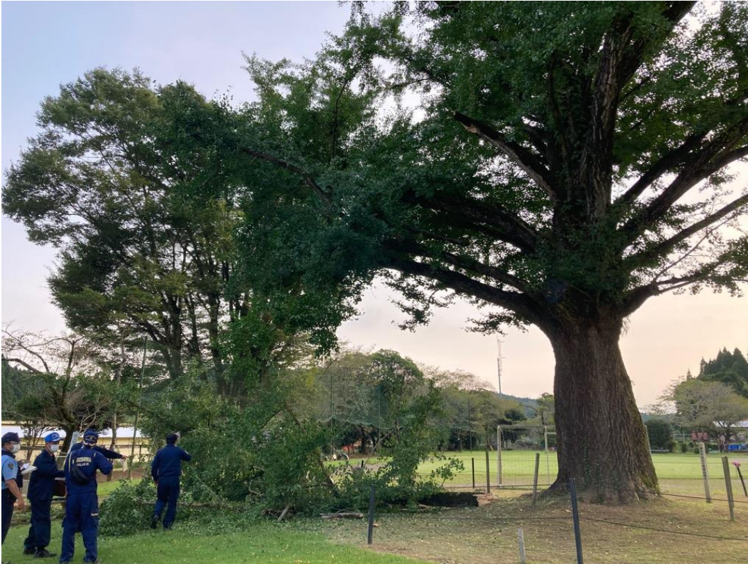
【写真 1】 事故発生場所