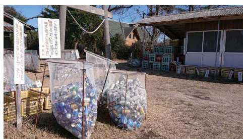
資源ごみ回収場所の様子