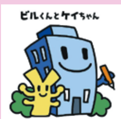
経済センサスキャラクター