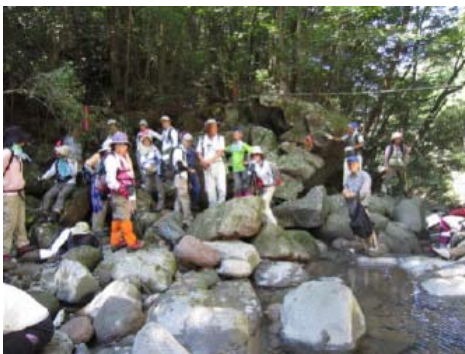
すがすがしい溪流で一休み

曾於市民は、曾於市総合大学(生涯学習講座)の「楽しい山行」コースで、日本ジオパーク委員会に認定された「霧島ジオパーク」と登山の勉強をしています。しかし、今年は新燃岳が噴火しているため、影響のない「蝦野岳」「甕岳」「郷土の森」等を機会に、曾於市民が霧島ジオパークに深く関わりをもつて、霧島ジオパークを盛り上げて頂きたいものです。