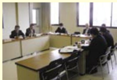
雲仙市議会まちづくり調査委員の皆様