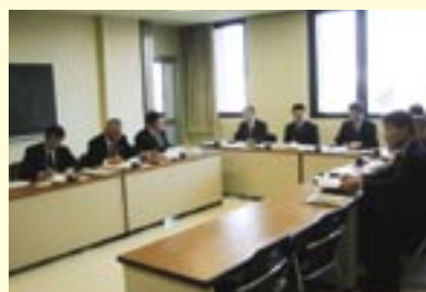
南島原市議会広報編集特別委員会の皆様