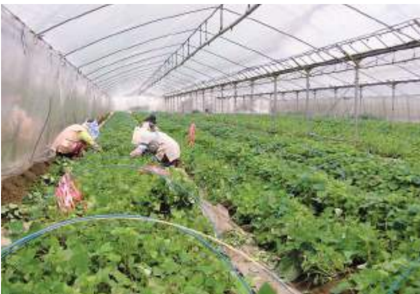
JAに委託されている甘しょ育苗センター（末吉町）