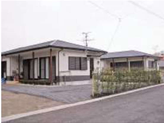
入居された地域振興住宅（末吉町柳迫）

いるし、今後の柳迫小学校の児童減を考えると今取り組む重要な事業である。計画を検討すべきではないか。