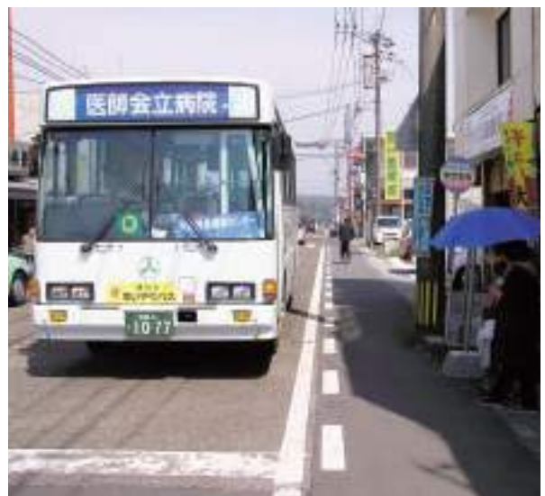
市内を縦断する思いやりバス

市長 市民の交流による市の活性化を図る目的で運行しているが、利用者が少ない状況である。思いやりタクシーを含めて市交通対策協議会等の意見を聞き、利用者増を図る努力をする。