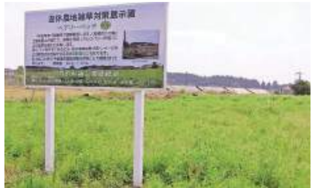
見事に成長したヘアリーベッチ

入学おめでとう♪ この春、財部小学校では52名の児童が不安と期待に胸をふくらませ入学致しました。 学校はみんなで楽しく勉強したり、遊んだりでき、遠足や運動会、学芸会というような行事もたくさんあります。 時代を担う子どもたちが、心身ともに健やかに成長していくように、関係の皆様と一緒に努力していきます。 （大川原）