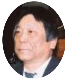
五位塚 剛 議員