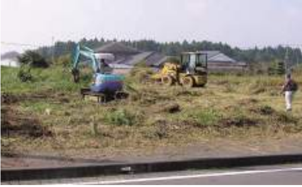
荒れ地状態の農地