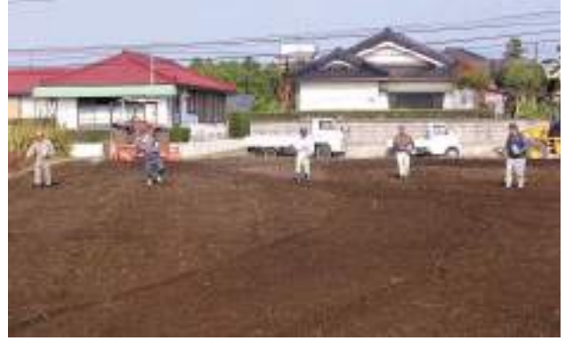
復元された農地への種まき

前号で紹介した遊休農地・耕作放棄地解消に役立つ、マメ科のヘアリーベッチが見事に成長し、雑草を抑制しています。いつでも農地に復元することができます。