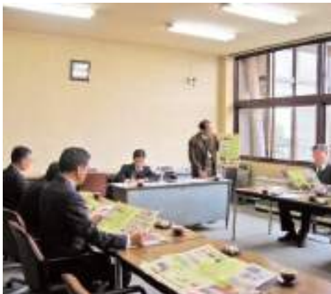
国東市の事務調査

路線バスの赤字により縮小、廃止されたことにより住民の足確保を図るために行った事業であり、