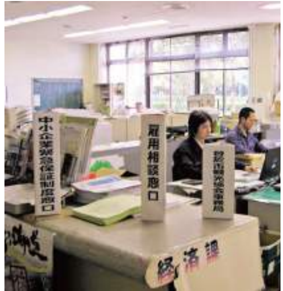
商工担当窓口の経済課

池田市長 市内には1,826の事業所、1万4,768人働いている。本市では不景気の影響はさほど受けていないようである。