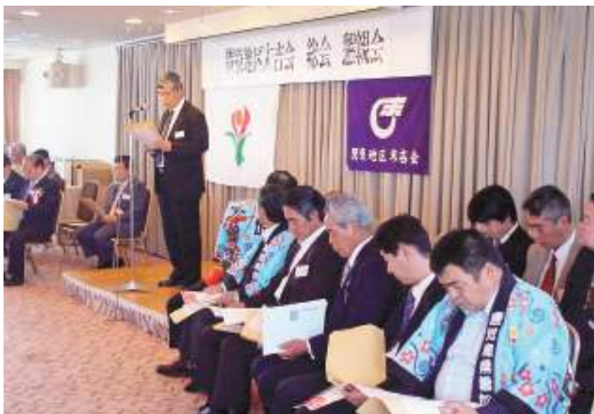
ふるさと会交流風景

市長 現在、県の竹林整備事業を一カ所のみ対応しているが、本市においては検討する。