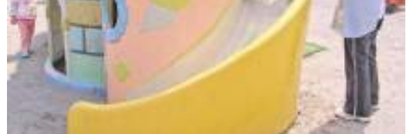
元気に遊ぶ園児たち