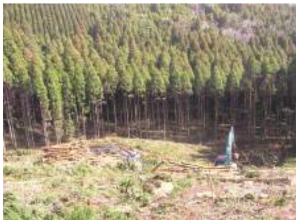
高性能機械を使った作業風景（森林組合）