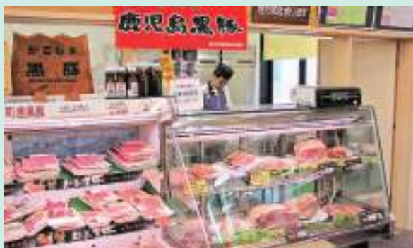
道の駅すえよし 四季祭市場

曾於市で生産される農畜林産物の全国へのPR、流通ルート拡充と消費拡大を図ります。