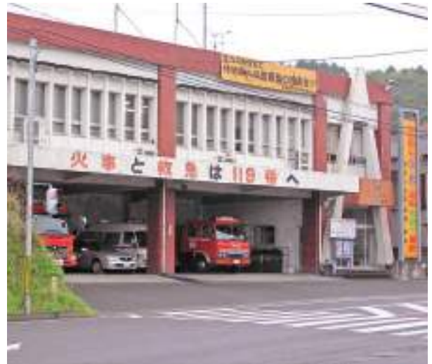
大隅曾於地区消防組合消防本部・北部消防署