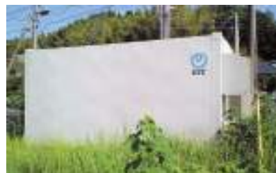
柿木交換局（末吉町）