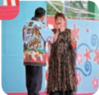
市民祭におけるカラオケの発表