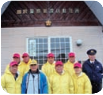
防犯拠点としての 深川駐在所と見守り隊

池田市長 昨年、県警の機構再編計画で廃止の対象となっていたが、猶予され、現在の状況となっている。