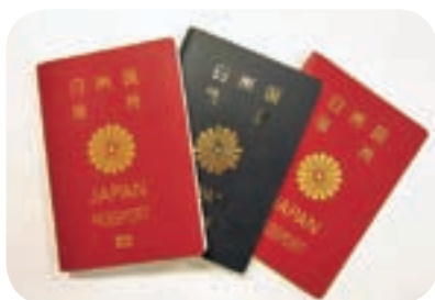
市の窓口で申請できるパスポート

答 平成25年度より申請者本人が曾於市(末吉・財部・大隅)の窓口で午前8時30分から午後5時15分までの間に申請することになる。新規発給の場合、約10日の期間が必要となる。なお、申請した支所においてパスポートは本人に受領してもらうことになる。