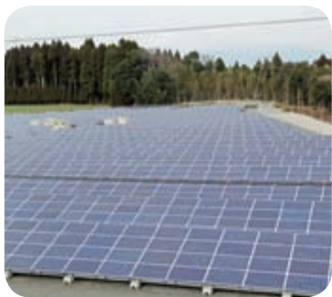
財部町正部のメガソーラー

合併特例債は延長されたが総額は変更ない。平成28年度以降に普通交付税が段階的に削減