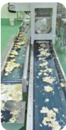
ゆずの搾汁状況(搾汁センター)

問 ゆずの生産加工の強化と販売開発が重要では。 市長 現在、24種類の商品を販売している。新商品の開発と販売ルートへの拡充について検討していく。