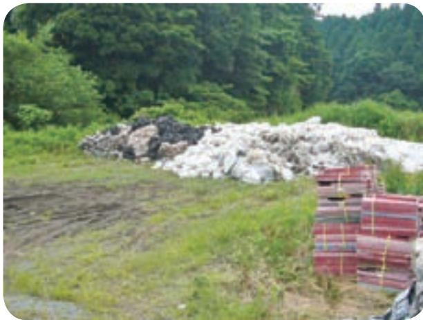
仮置きされた廃プラ（クリーンセンター内）

缶1862缶となっており、特にポリエチレンについては、前年度より、26t増加している状況である。 集荷については、農家の意識と利便性を考慮して、年6回以内に分けて集荷体制を整えている。