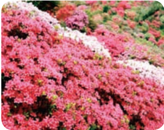
曾於市の花 つつじ