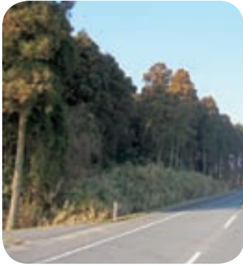
買収が始まった胡摩地区の山林

問 相続手続きの難しい土地など34筆あり、事業はうまくいかない。また、遺跡調査や白毛川への農薬の汚染などどうするのか。 市長 誠意をもって努力していく。