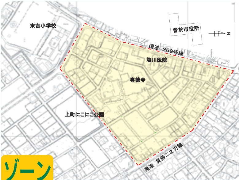
区画整理地内に設置された速度 30 km制限指定区域

答 現在の交通事故多発に伴い、警察署より市道に速度制限30km区域設定の要望があり、今回は末吉小北東側、専徳寺周辺市道に設定する。その為の標識板設置の予算化である。