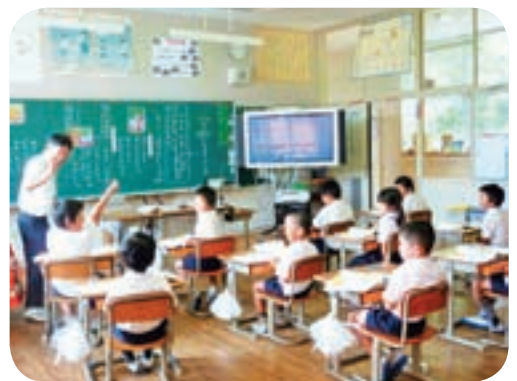
電子黒板での授業のようす（楳小学校）

問 投票区の統合も計画されているが、各小学校に1台以上の車イスを配備できないか。