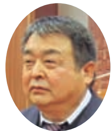
海野 隆平 議員