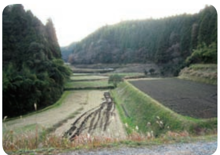
大隅町立馬地区のほ場整備計画地

地方分権推進関連の法律の制定に伴い、今まで国で定めていた基準を、市町村の条例で定めるようになったための改正である。 住宅関係は、整備基準と入居資格(収入基準、最高15万8千円、特例21万4千円)の条