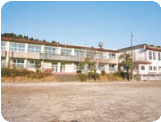
旧 南之郷中学校全景