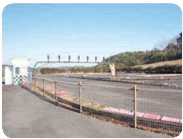
運用中止されているサーキット場

市長 スキッドレーシングカーの老朽化や部品の調達不能等により今後の再利用はできないものと考えている。跡地利用については、具体的な活用について、今後方向性を出していきたい。