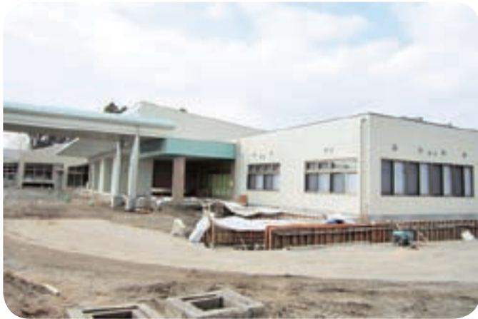
完成間近のそお生きいき健康センター

答 県の100%補助による事業で、すみよしの里など6事業所へ相談支援業務を委託するものであり、相談支援活動のために使用する自動車、パソコン等の購入及び研修等に要する経費を補助対象としており、体制の充実強化を図ることを目的としている。