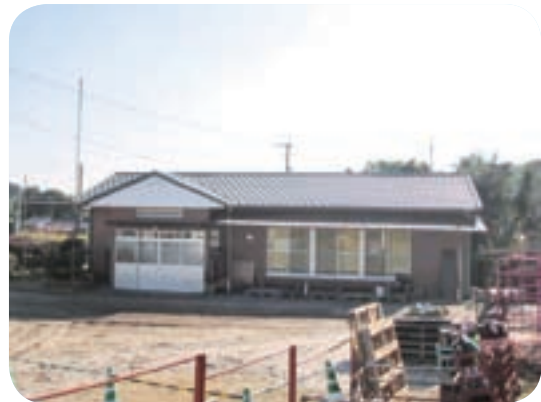
改修された新城公民館

本来、前年度繰越金は財源として翌年度に消化すべきものである。これだけの財源を残していくのであれば、もう少し早い段階で各課の要望を取り、市民や市の全般に向けて予算を効率よく使っていくというのが健全な財政である。