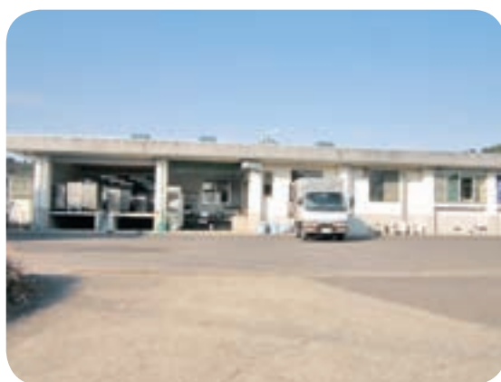
整備された財部給食センター

教育長 小学校の統合については、市の学校規模適正化計画に沿って、平成25年度から検討委員会を設置し、地域の意見等を十分参考