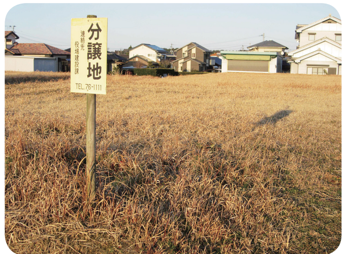
利活用が待たれる市有地

手を尊重して練習や試合ができるようにすることを重視する運動であり、心技体を鍛え、人間力を高め、礼節を尊重するなど、スポーツとは違う武道学習の目標を達成できるように支援している。