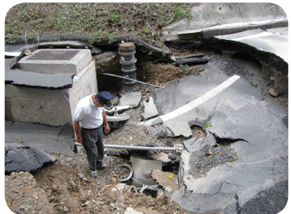
被害状況（石之脇地区）