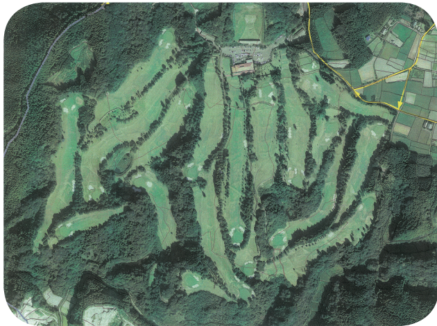
三州カントリークラブ全景