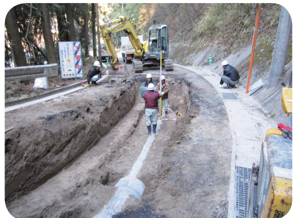
復旧作業状況（石之脇地区）