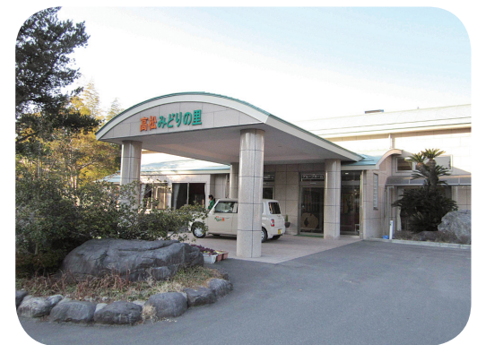
グループホーム高松みどりの里