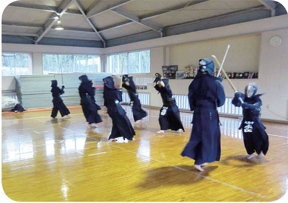
夢実現に向かって一本!

ジョンを市民に浸透させるべきではないか。 植村教育長 ビジョンを具現化させるために、学校教育の基本目標を「覇気に満ち、常に夢実現にチャレンジする児童生徒の育成」