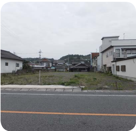
財部中央分団詰所建設予定地

答 焼却できないごみ2千トンから3千トンを、大隅の最終処分場へ搬入する予定である。これに伴い、今年度よりコンポストなどの生ごみ処理器を購入した時の補助金制度を導入した。