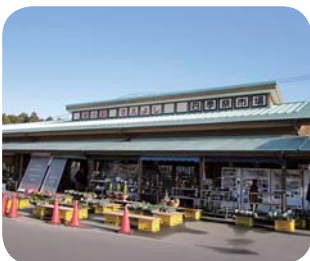
増築予定の道の駅すえよし