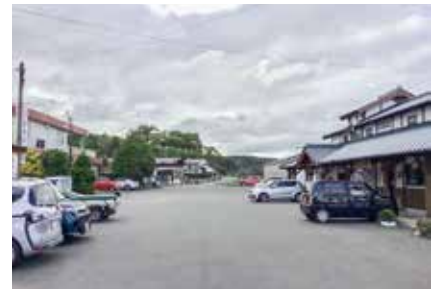
やがて屋台村で賑わうであろう 財部駅前の現在

問 公約であった屋台村は前年質問した時はほとんど手付かずであったが、1年経って計画はどのように進んでいるのか。