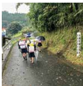
遠い所でも徒歩通学の 大隅町・末吉町