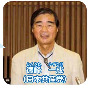
とくみね かつなり 徳峰 一成 (日本共産党)