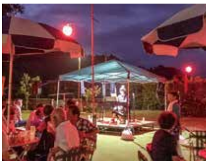
夜市でのピアノ演奏の様子