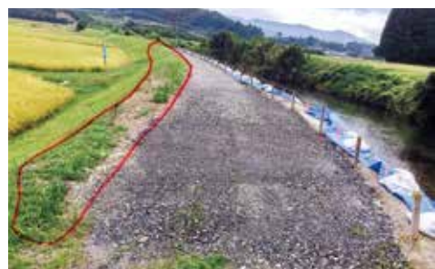
補修後の堤防 被災時残っていたのは左側雑草部分だけ

市長 終戦後の昭和24年頃着手し、大型機械がない時代で人海戦術により、約100人の作業員でモッコによる土砂の運搬や掘削で築堤等を造りあげたとの記録がある。近年は、強固な構造物等に復旧し、河川の狭い箇所等は、局部改修等の事業を実施している。