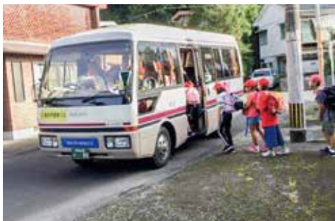
18年目をむかえる財部の通学バス

教育長 廃止する考えはない。市内全域を、どうするのか、検討に入ったところである。