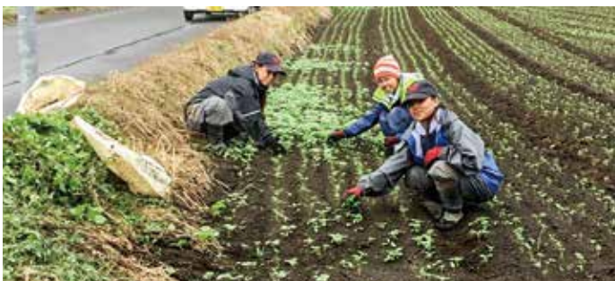
曾於市で頑張っています