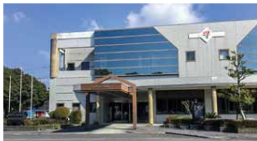
利用者のプライバシー 大事にしましょう