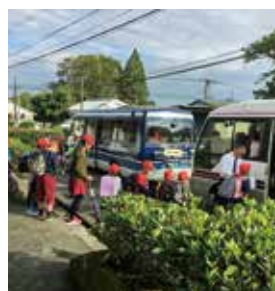
2km以上はバス通学の 財部町