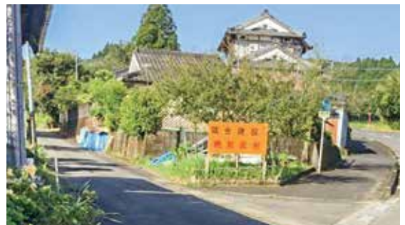
川畑地区の養鶏建設に対する看板