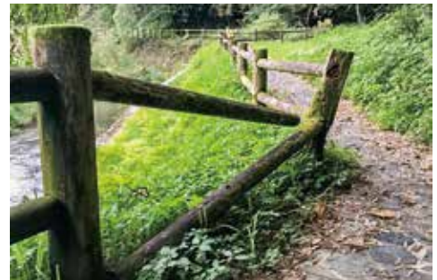
危険な朽ちた木柵

市長 伐採届出件数、提出面積が減少しており、以前と比べると道路破損などの苦情は聞いてない。