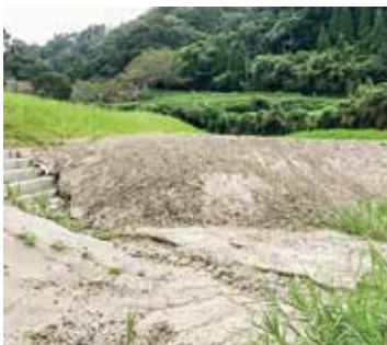
除去されない河川内の土砂

問 公園入口のガードパイプ破損、トラロープの経年劣化破断で見苦しくなっているが。