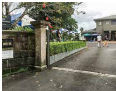
山んなかマーケット開催中