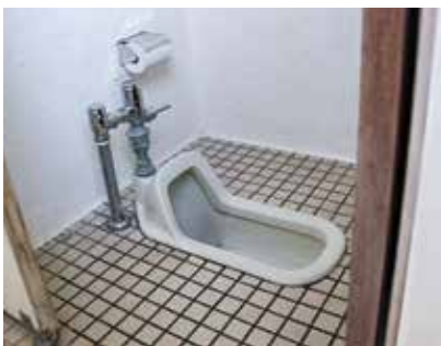
末吉駅舎跡の和式トイレ

問 高齢者、障害者、若い世代に洋式化水洗トイレの要望が多いが、遅れている。末吉駅舎跡を皮切りに抜本改善を求めたい。