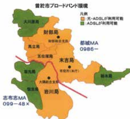
曾於市内の光回線の整備状況