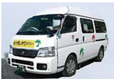
おもいやりタクシー

市長 本市に最も適した公共交通について直ちに答えが出るものではないが、今後導入可能か検討していきたい。