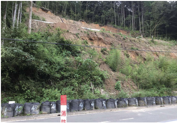
市道河原・飛佐線の災害現場

歳入は、災害関連地域防災が け崩れ対策事業の採択による国 県支出金や市債等の増が主なも のであり、歳出は、農道整備事 業の防災対策事業に伴う農道法