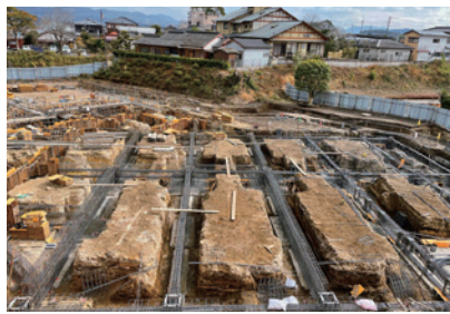
建設中の本庁増築庁舎