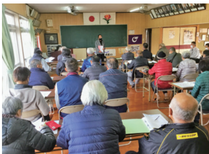
コミュニティ協議会設立の準備会

ティは、公民館より大きな母体となって、地域の全ての方を対象に活動を推進していくことで、より多くの方のコミュニケーションのとれる、ふれあいの場となるのではないかと考えている。