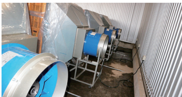
種芋蒸熱処理機による蒸熱消毒状況