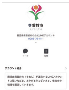
曾於市の公式ラインのアカウント

企画課長 SNSを利用したマーケティング戦略について、年代や性別などが細かく分析できることが分かったので、今後は利用しながら戦略を練っていく。