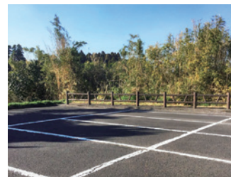
末吉総合センターの駐車場。スケートボードの練習をしている若者もいる。

市長 やごろうの里公園など、曾於市全体を見ながらアーバン・スポーツの施設として適切な場所を選定していく。