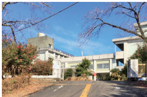
拠点となる財部高校跡地

問 開設までのスケジュールで、曾於市の対応はどうか、当初予算、一般財団法人の設立等について伺う。 市長 令和3年度は地方創生拠点整備交付金の事業採択に向けて、国・県への事前相談を行っている。国は、今国会で補正予算成立を目指しており、本市でも3月議会に向けた対応を検討している。一般財団法人の設立に向けては、令和4年度中の設立を検討している。