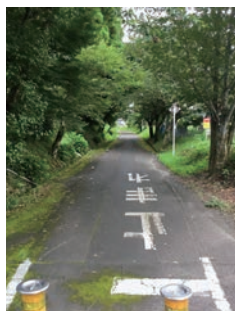
マインドロードの現状