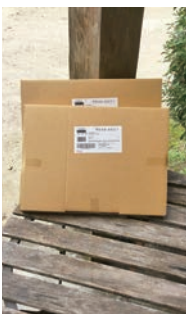
配布されたマスク

問 お茶消費拡大のための茶葉配布事業はよいことであるが、事業外目的の事業である。どう思うか。