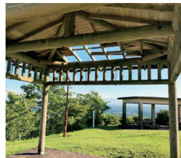
陣が丘の東屋の現状