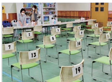
集団予防接種会場 (そお生いき健康センター)

市長 市民がワクチン接種を受ける場合は、市内の14医療機関と、集団接種会場のそお生いき健康センターで接種を受けることができる。