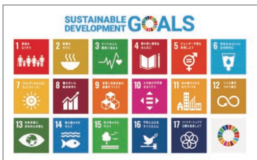
SDGs (持続可能な開発目標) 17の目標

市長 地域情報化計画におけるSDGsの取り組みは行っていないが、第2期曾於市総合戦略における重点プロジェクトの18施策のうち、16施策についてはSDGsの指針に沿った事業を展開している。