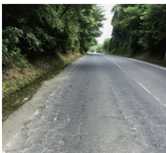
改修が望まれる広域農道