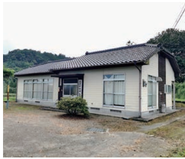
広津田自治公民館

総務課長 18名程度しか収容できない。多くの避難者がいれば、他の施設に避難していただく予定であるが、現在の状況が適切とは思っていない。