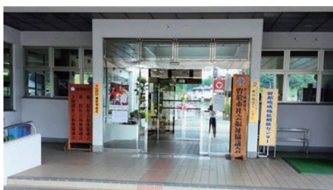
今回から投票所が変更になった 財部保健福祉センター