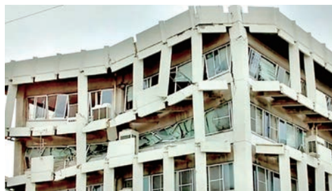
熊本地震で倒壊した宇土市役所大隅・財部支所の建替えは急務です。