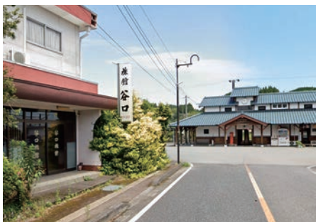
財部駅前 旧谷口旅館