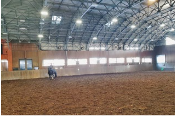
屋内馬場イメージ

① 誘客を図る乗馬事業の計画運営については、シミュレーションで日本の乗馬人口の推移などの数値を基にしているが、開設後の施設全体の管理費を含め、再度、精査するように。 ② 臭気の問題や利用者の駐車場の確保、利便性についても、明確な説明を求める。