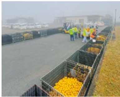
搾汁センターユズの集荷状況

市長 ユズ振興については、平成元年度から取り組んでおり、九州でも有数の産地である。今後は買収単価の高い品質を高めていくことが生産者の所得向上につながる。また、栽培講習や肥培管理等を充実させる。