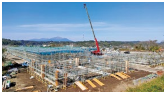
南九州畜産獣医学拠点の工事 令和4年12月末時点