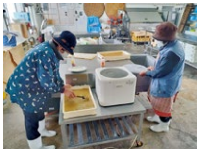
ゆべし作りの様子