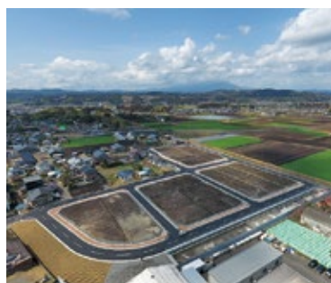
さくら並木ニュータウン

問 今後、本校区の分譲地も住宅取得祝金等を支給するように要綱を改正すべきではないか。