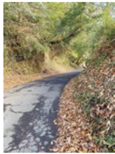
法面がコンクリートだと管理が良い。