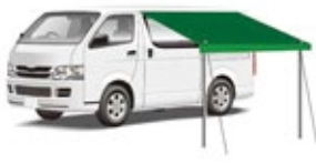
コネクテッドカーイメージ