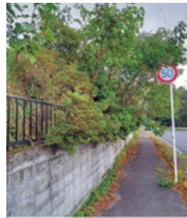
高齢化のため管理できない

市長 基本的に個人のものなので本人が管理するのが原則である。どうにもならない場合は市で対応する。