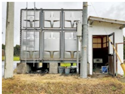
水道組合の心臓部