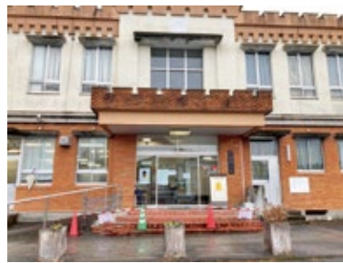
図書館関係者を入れないと理想論ばかりになる