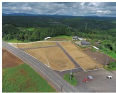
大隅南地区分譲地