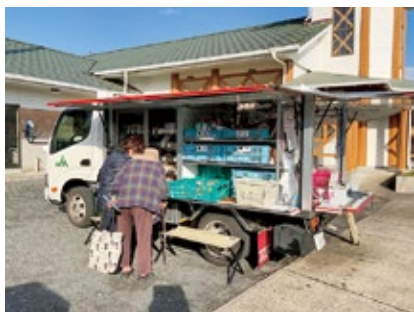
買い物弱者を救う