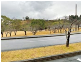
弥五郎の里桜の木

市長 シラス土壌の影響を含め専門家の診断を仰ぎ、診断結果によつては、必要な手立てや処置を行う。