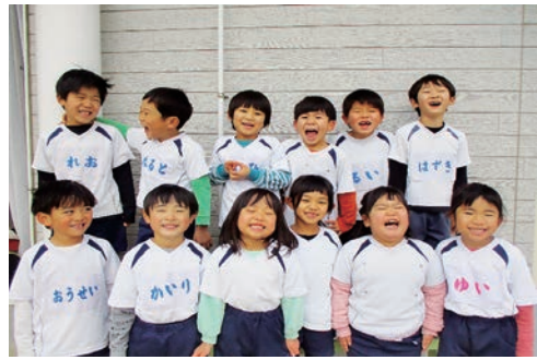
小学校へ希望を膨らます子どもたち