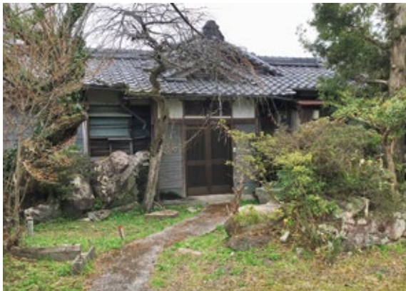
今後、解体も含めて検討される古民家