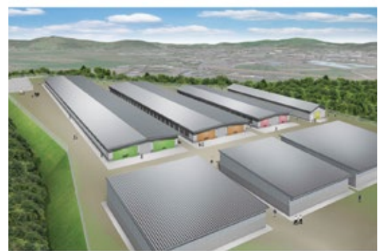
今春オープンするSKLV