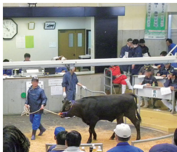
価格が下落した市場

市長 支援していないが、規模に関係なく経営を継続していただけるように支援したい。