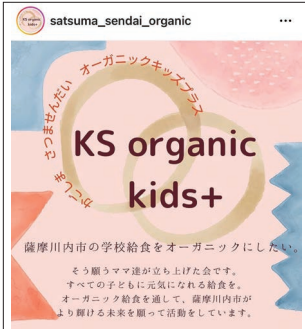
市民団体が活発な活動を行っている薩摩川内市