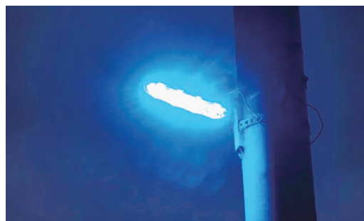
本市に設置されている防犯灯