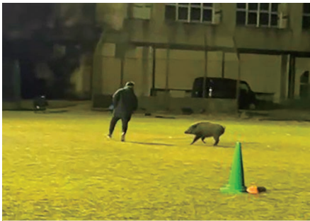
イノシシから逃げる住民