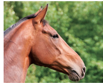
馬は直接的な経済動物ではないので収益性は厳しく見る必要がある

企画政策課長 現在福岡県宗像市のカナディアンキャンピング乗馬クラブを運営業者に予定しており、試算では初年度より黒字を想定している。