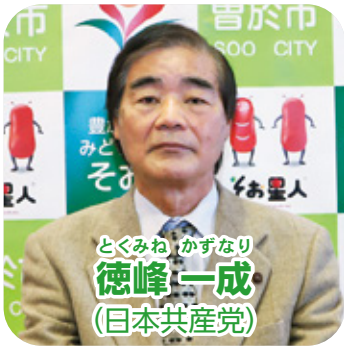
とくみね かずなり 徳峰 一成 (日本共産党)