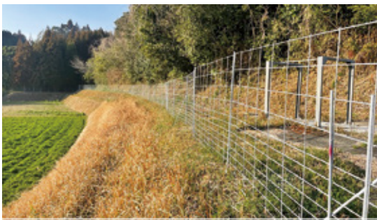
防護柵事業の推進を

市長 生コンなどの材料支給を活用していただきたい。規模が大きい場合については、対応を早急に検討する。