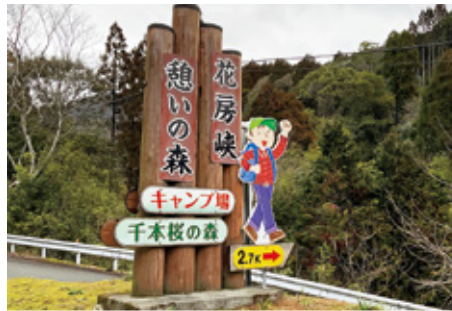
新田山憩いの森入口に立つ千本桜の森の看板

問 フラワーパーク予定地跡地を負の財産にしないため、森林環境譲与税で対応すべきではないか。