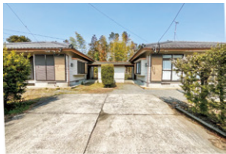
借り手のない空き家。貸せば市の収入増