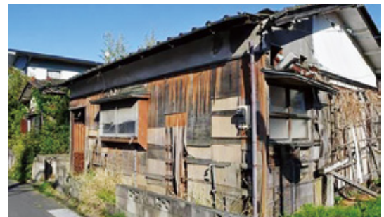
空き家が増えると景観も悪くなる ※フリー素材の写真を掲載しています。