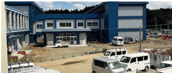
このままがいいのか？更に飛躍を！南九州畜産獣医学拠点の工事 令和5年3月16日現在

外国人実習生も 同じ市民です。 貢献しています。 事業維持拡大のため にも部屋確保から。