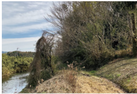
大雨の時に心配だ