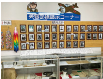
郷土の貴重な遺産