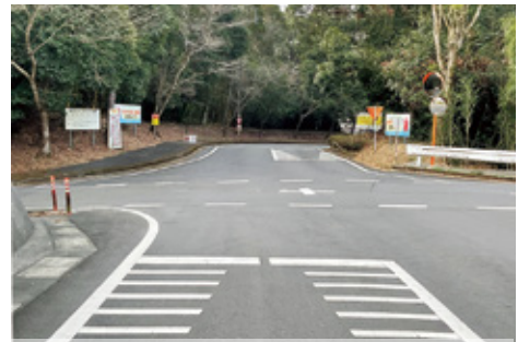
事故の多い交差点 安全第一で