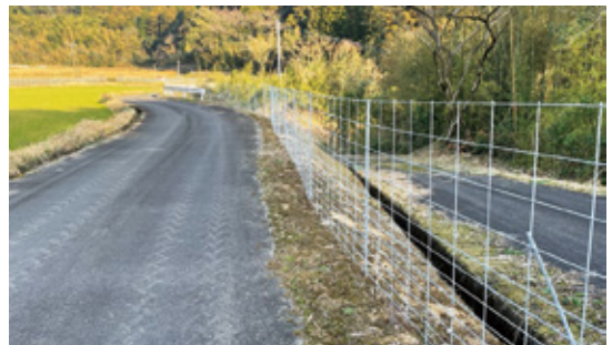
イノシシ対策用の防護柵