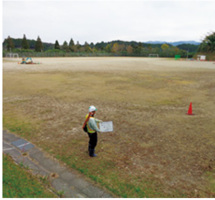
末吉中学校グラウンド調査の様子

答 当初昭和30年から40年代にかけて盛土を行いその後校舎の建替えの際に再度盛土を行った。今回中学校のグラウンド部分の地山と盛土の境目らしき箇所が亀裂が入ったため、必要な調査を行っていく。