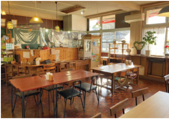
たからべ森の学校 (旧財部北中学校) 内の『たか森カフェ』

旧財部北中学校は平成25年4月1日から誘致企業として職業訓練事業を行う有限会社サイバーウェーブに無償で貸し付けています。今後も継続して事業展開することにより地域での雇用労働力の創出及び地域の活性化につながるものとが見込まれることから引き続き5年間無償貸付けするものです。(※令和10年3月31日まで)