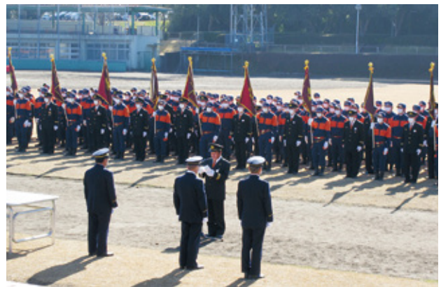
令和5年曾於市消防出初式の様子

問 消防団の地域行事への参加は支給対象になるのか。 答 鬼火焚きの際の警戒活動などの消防団でなければできない活動については、支給対象になる。