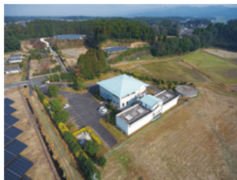
下水道浄化センター

答 下水道浄化センターに設置してある監視装置のシステムをクラウド型へ再構築するため、また、同センターの土壤脱臭施設の吸着材を入れ替えるため、それぞれ工事を行う。