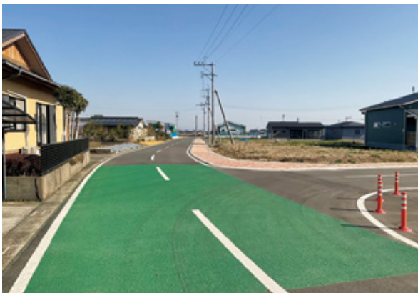
さくら並木ニュータウン内の市道

宅地造成された財部のさくら並木ニュータウン内の道路を一般交通に供するため、さくら並木ニュータウン1号線から5号線までの5路線を市道として認定するものです。