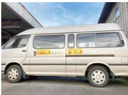
曾於市内を回る思いやりタクシー

思いやりタクシーは曾於市管内だけだが、近隣の市を回るのであれば、それぞれの市、議会の承認等が必要である。