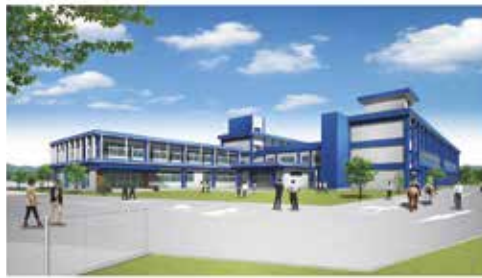
南九州畜産獣医学拠点施設