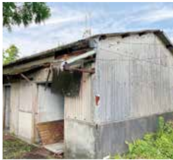
老朽化が進んでいる倉庫

市長 私も同じ考えである。県と土地交換時に取壊しについて10年間の制限があり、再度県と協議して対応していきたい。