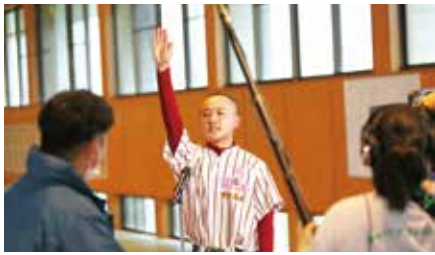
7月1日に生放送された選手宣誓 曾於高校野球部主将