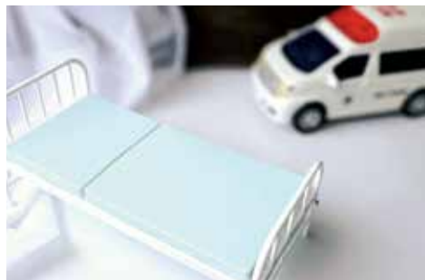
市民への安心安全