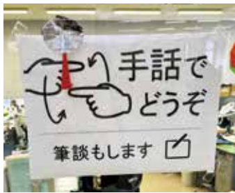
いちき串木野市の串木野庁舎、福祉課の窓口

人権教育にとって大切。今年度は9校で手話学習活動を行い、ポスター掲示も後押しする。