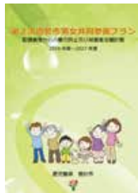
曾於市のホームページにも掲載されている