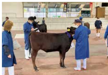
曾於市春季畜産品評会(大隅地区)

現在、飼料・肥料・資材高騰の厳しい経営環境の中、生産農家の生産意欲に対する熱意を感じ、更なる畜産振興に努力されることを期待するものであります。