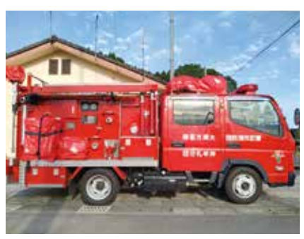
大隅方面隊北分団取得予定車両と同型の水槽付小型動力ポンプ積載車