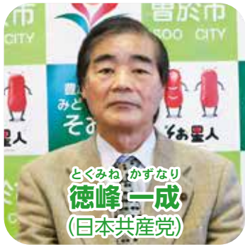
とくみね かずなり 徳峰 一成 (日本共産党)