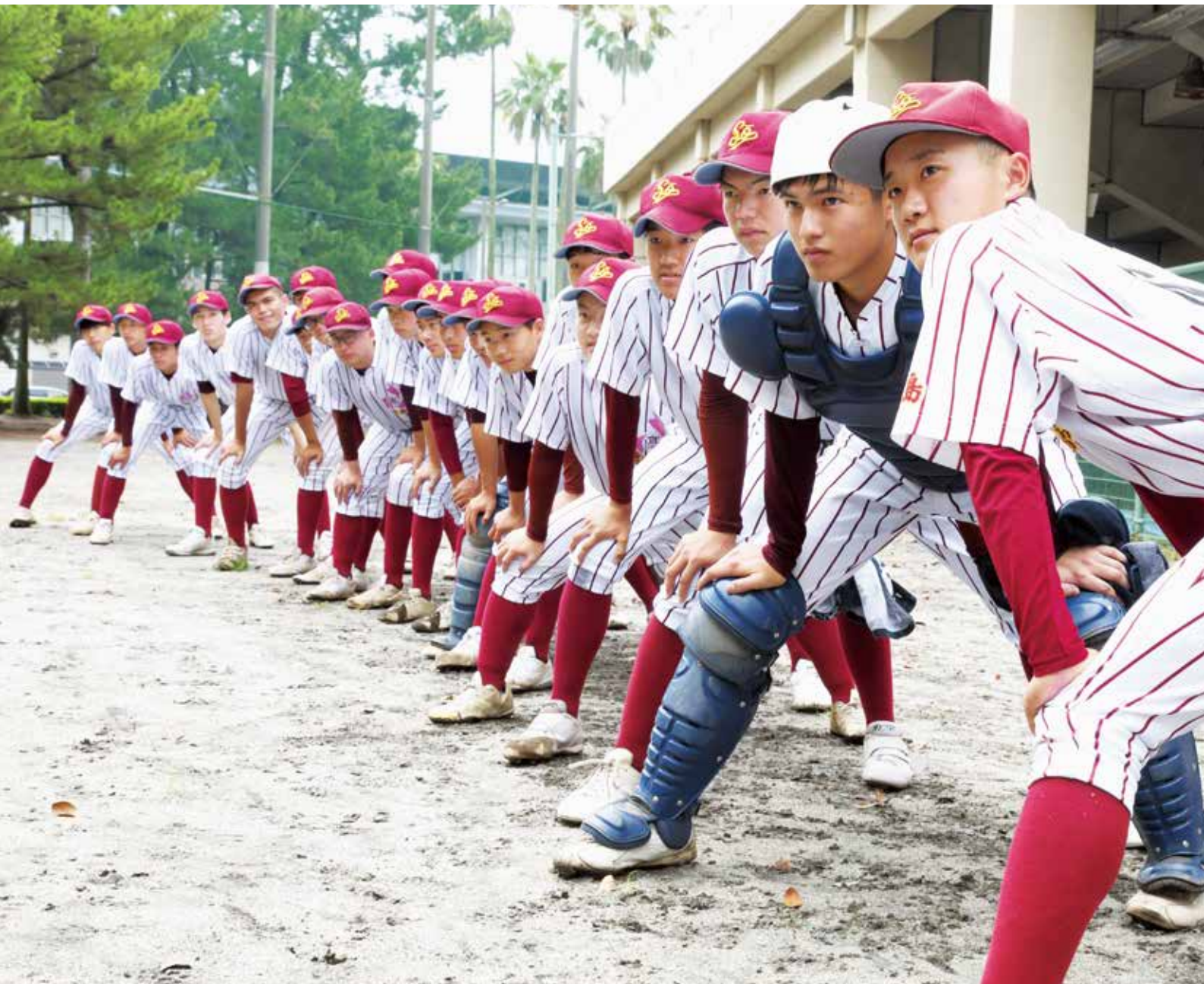
試合前の曾於高校野球部 (P20参照)