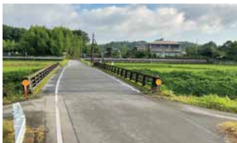
先生が命名した顕彰館前の報効橋 (昭和43年5月設置)

市長 訪問団が来られる11月3日の弥五郎どん祭りまでにはと考えている。全国から来訪者が増加した場合を考え協議したい。