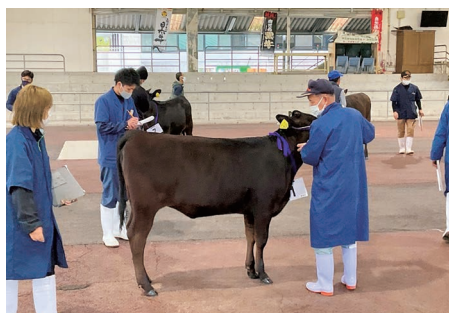
曾於市春季畜産品評会(大隅地区)

現在、飼料・肥料・資材高騰の厳しい経営環境の中、生産農家の生産意欲に対する熱意を感じ、更なる畜産振興に努力されることを期待するものであります。