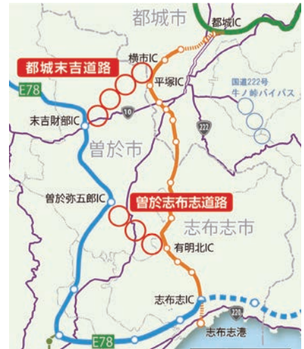
要望路線道路網図

市長 都城末吉道路のルートについては、末吉道の駅、財部にインターを整備、曾於志布志道路では、八合原にインターの整備をすること、商店街への影響が出ないように要望していく。