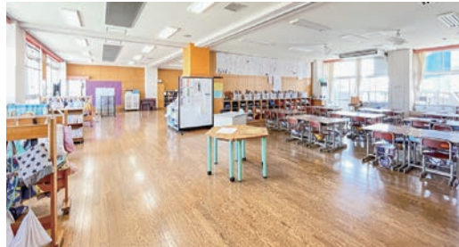
学びの共同体を実践している 神奈川県茅ヶ崎市立浜之郷小学校

たいと思ったら、曾於 市に引越すするので はないか。 市長 教育長の決意が 大事だが、上からの強 制ではなく、全教職員 とその目的を共有する ことが大事なので、頑 張ってほしい。