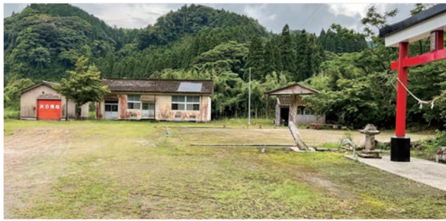
大隅町須田木小学校跡地のふれあい広場