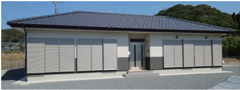
令和5年度に整備された中野団地（大隅町）

問 過去の市長答弁でも、一戸当たり1500万円を超える建設費が負担であり、見直しを検討しているとのことだが。