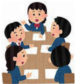
兵庫県芦屋市では生徒会長に100万円を預け使い道を議論させている