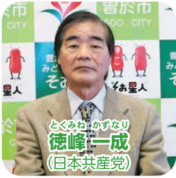
とくみね かずなり 徳峰 一成 (日本共産党)