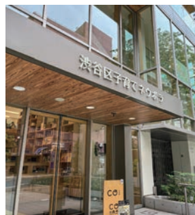
子育てに関する部署を集約させた一体型の施設