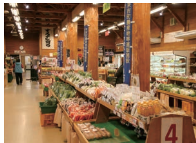
漬物といえば、ふるさとの味 楽しみをうばわないで！