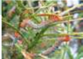
キオビエダシヤクの幼虫→