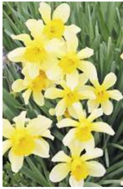
水仙 (財部中谷地区)