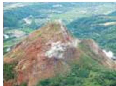
洞爺湖有珠山（北海道）昭和火山は1943～45年に有珠山麓の畑が火山活動により山になりました。