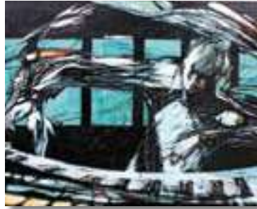
吉井淳二賞 一般部門