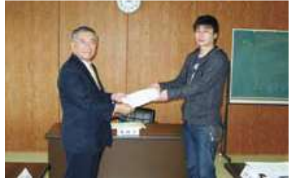
2月23日、まちづくり提言書が手渡されました。

は、企業誘致や定住促進は重要な施策のため、高速道路などの交通体系や情報通信網の整備など、企業が進出しやすい環境を整えるよう提案します。 観光について