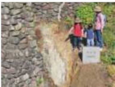
糸魚川（新潟県）糸静線断層露頭は日本を二つに分ける大断層、糸魚川静岡構造線。