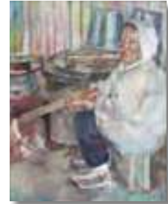
吉井淳二賞 高校生部門