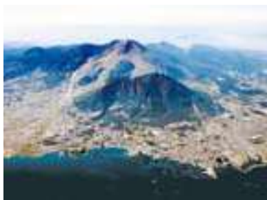
島原半島（長崎県）雲仙岳平成新山（茶色い岩山）と眉山（手前の緑色の山）を空撮。