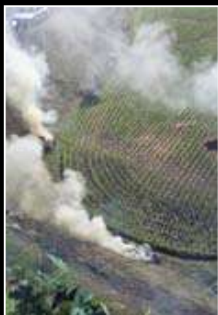
佳作 「収穫をおえて」 間 民子氏（霧島市）