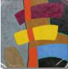
吉井淳二賞 招待作家部門