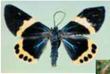
↑キオビエダシヤクの成虫