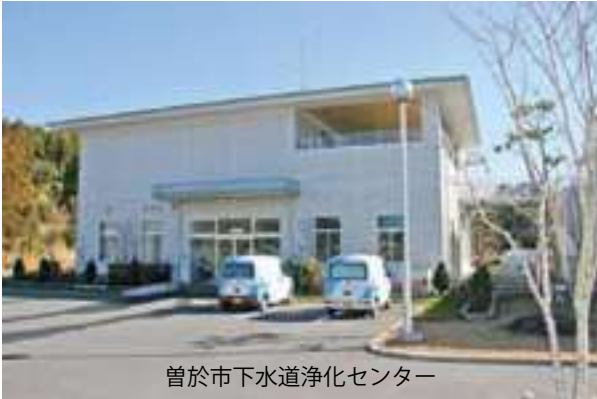
曾於市下水道浄化センター