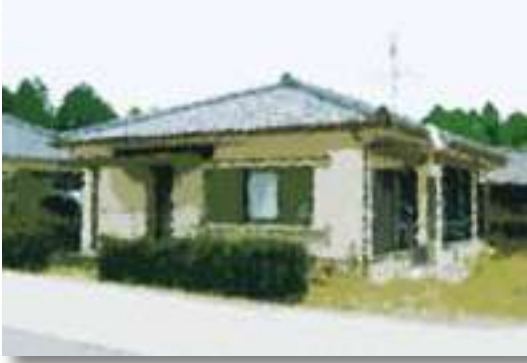
地域振興住宅イメージ