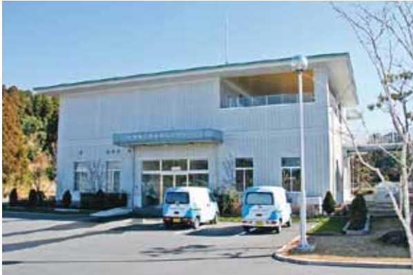
曾於市下水道浄化センター