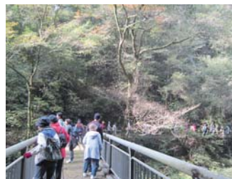
昨年のツアーの様子