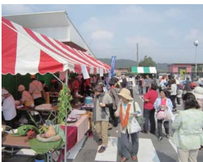
昨年の「がねコンテスト」