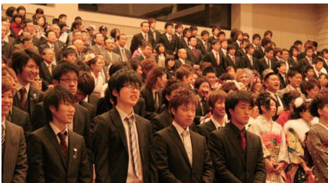
昨年の成人式の様子