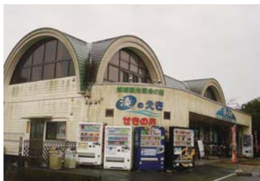
滝の駅「せきのお」 ☎ 0986-37-3405

も、「観光を通じたまちづくりになれば」と滝のように力強いまちおこしへの思いは膨らみ続けます。