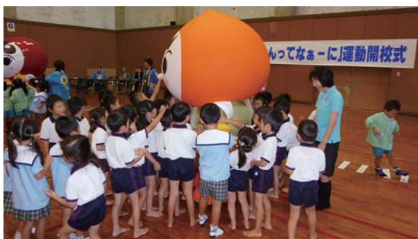
イメージキャラクターとふれあう幼児たち

また、12月4日～10日までの人権週間期間中に各支所玄関ロビーにおいて、参加した園児のぬり絵を展示いたします。