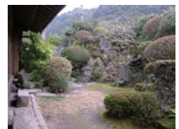
国指定名勝 志布志麓庭園

志布志麓は、武家屋敷や寺院が立ち並び、さらに近代以降に手を加えられつつ、継承された多くの住宅庭園が残されていて、国の文化財に指定されているものもあります。