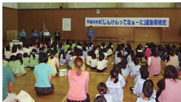
人権擁護委員のはなしを聞く様子