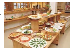
旬の食材で作った料理が並びます

えびの産の旬の食材を使ったヘルシー志向の料理が楽しめます。常時、30品前後の料理を心ゆくまで味わえます。