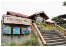
エコミュージアムセンター

リニューアルで、センターには、登山者の質問などにお答えする受け付けカウンターが設けられます。展示物では、「霧島山の独自性や成り立ちを紹介するコーナー」、「霧島山の見どころを紹介するコーナー」、「今と昔の霧島山の風景を写真で見比べるコー