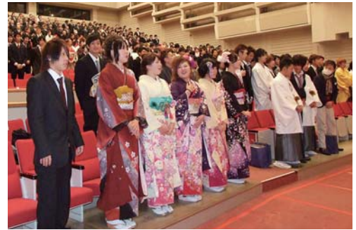
華やかな中にも整然とした式の進行