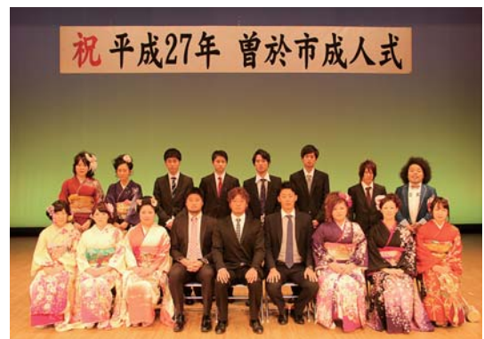
大役を務めた実行委員の皆さん