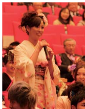
プロ野球選手に質問をする 新成人