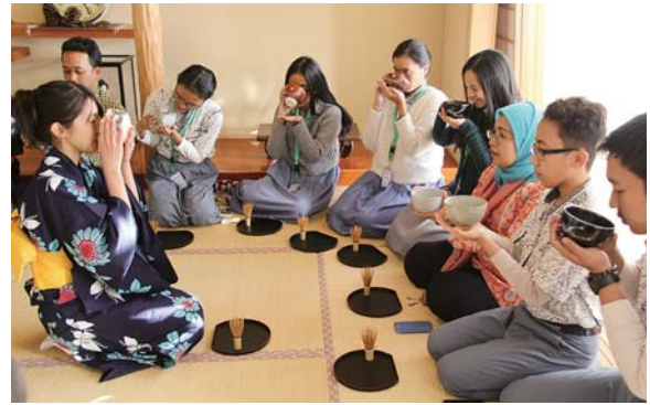
茶道を体験するインドネシアの高校生

12月16日、17日にインドネシアの高校生と先生の計24名が曾於市で様々な活動を体験しました。これは、曾於市観光特産開発センターと福岡の旅行会社が連携して企画したものです。 1日目は民泊先へ宿泊し、翌日は岩川保育園でそば打ちや園児との交流、ひよっとこ踊りの体験を楽しみました。その後、末吉高校生と交流。茶道や書道、空手、弓道などを一緒に体験し交流を深めました。曾於市民の心からのおもてなしが伝わったようで大変喜んでいました。