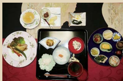
「サービスランチ」 1,500円(税込)