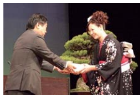
市長から記念品の贈呈