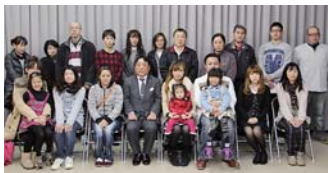
12月12日に行われた 住宅取得祝金等交付式