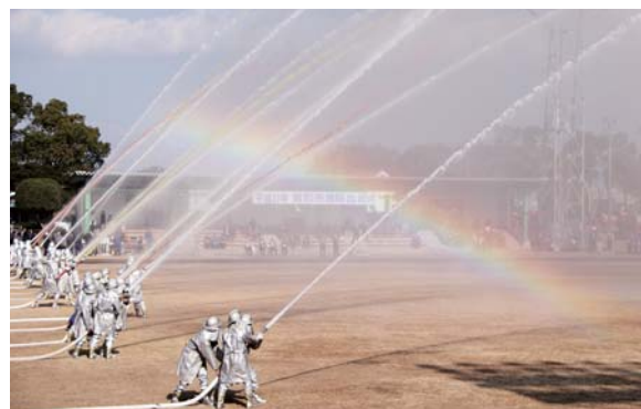
色鮮やかな一斉放水