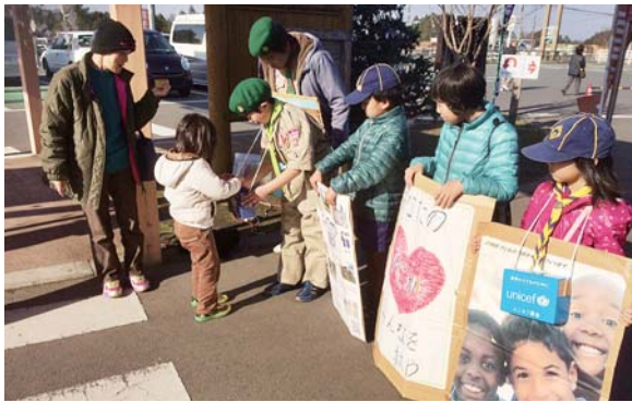
募金を呼びかける団員