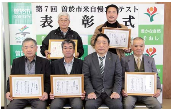
コンテストで最優秀賞、優秀賞に輝いた皆さん

11月26日、鹿児島県芸術文化奨励賞の授賞式が行われ、「巨人伝説太鼓衆 大隅弥五郎太鼓」が団体表彰されました。 同団体は、昭和56年に活動を開始。大隅弥五郎どん祭り以外にも、県内外、海外でも精力的に演奏活動を行っているほか、小中高校生の太鼓チームをつくり、青少年の健全教育、後継者育成にも取り組んでいます。 地域文化の向上発展、国際交流の促進等に寄与しており、今後より一層の活躍が期待されます。