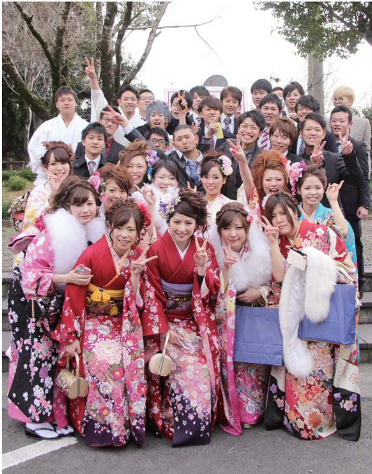
同級生みんなで記念撮影