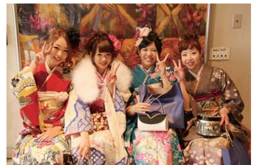
色鮮やかな振り袖に身を包み 晴れやかな笑顔を見せる新成人たち