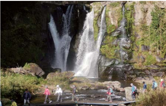
桐原の滝を眺めながらのトレッキング

12月13日、観光特産開発センターと曾於市が都城市と連携し「第3回霧島ジオパーク・トレッキング」が開催されました。 53名の参加者は、大川原峡から関之尾滝までの12kmを観光ガイドと一緒に地質や植物を勉強しながら、自然の中に気持ちよく歩きました。お昼は中谷小学校でゴッタン弁当と温かい豚汁を食べ満足していました。 参加者は「孫と一緒に歩いて嬉しかった」「財部にこんな素敵なおところがあるのに感動した」と話しました。