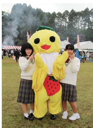
末吉高校家庭クラブが作成したゆるキャラ「ずっちゃん」