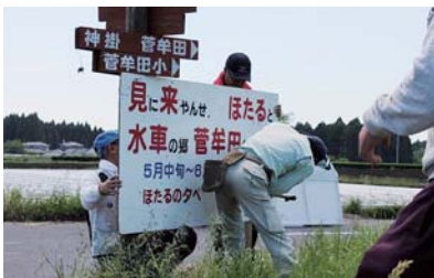
菅牟田校区公民館の活動風景