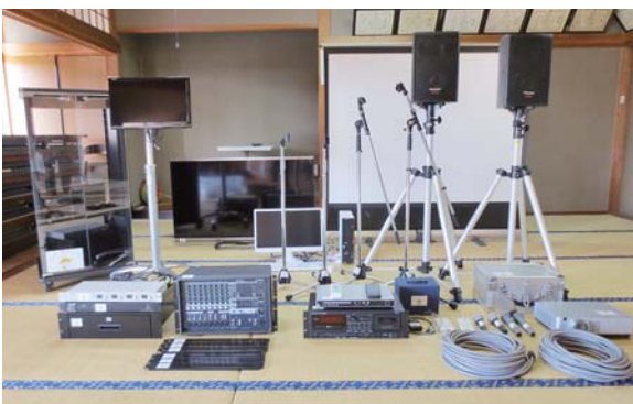
宝くじ助成金で整備された音響設備

8月22日、曾於市総合大学「ジュニア陶芸」講座の受講生が、日置市東市来町にある「美山陶芸館」へ研修に行きました。 研修では、作陶の方法や道具の使い方の説明を聞き、その後作品の制作に取り掛かりました。子どもたちは、指導者からアドバイスをもらいながら熱心に取り組み、色を塗ったり模様を付けたりして工夫をこらした個性豊かな作品を作り上げました。新鮮な環境とベテランの指導員のもとで充実した楽しい研修となりました。