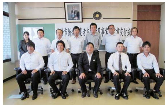
新規就農者の皆さん