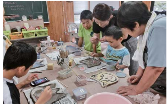
皿に色を付ける子どもたち

9月13日、末吉総合センターで「鹿児島情報高等学校吹奏楽部コンサート in ぞお」が開催されました。 第1部はマーチ「希望の光」から始まり、全7曲を披露。県内トップレベルの演奏に来場者は聞き入っていました。第2部は「AKB48」の演奏に合わせてコスチューム姿でダンスを披露するなど笑いを誘う場面もありました。また、手話を交えた東日本大震災復興応援曲「花は咲く」の演奏では、涙ぐむ来場者もいて会場は温かい空気に包まれました。