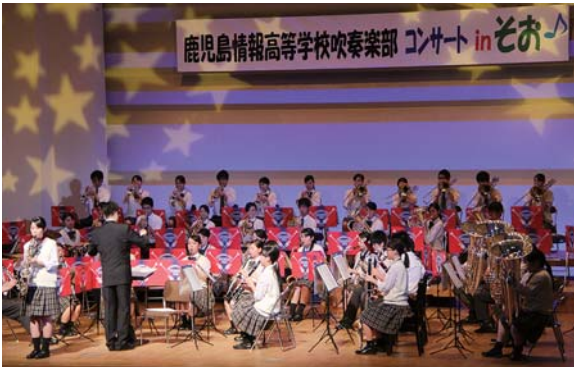
心に届く演奏を披露する情報高校の皆さん