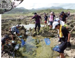
タイドプール観察（潮だまり）

島から見学することもできました。今回の研修のメインである縄文杉登山では、長く険しい22キロの道のりを約11時間かけ、1人もリタイアすることなく踏破（とうは）することができ、2泊3日の研修活動を無事に終えることができました。世界自然遺産である屋久島の大自