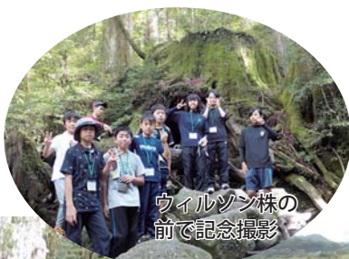
縄文杉の前で 記念撮影