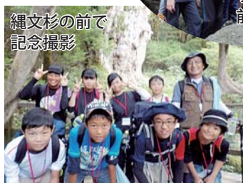
縄文杉の前で 記念撮影