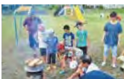
深川小：ミニキャンプ