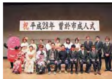
平成 28 年の成人式実行委員