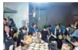
高岡小：親子キャンプ