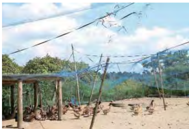
大きくなって戻ってきた薩摩鴨。農場は広く、ストレスが少ない環境でクラシックを聴かせながらしばらく育てる。

いや、東京では都市開発をしていたので全然ですね。50代でこっちにきて、有機肥料をやろうと思ったから畜産の町で面白いって聞いていた末吉にきたんです。