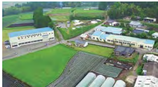
右手が本社。左手は昨年できたばかりの新工場。本社は曾於市だが、工場は県境を越え、宮崎県都城市になる。

それに、独立を決めたときから「特許のとれる開発をして、世界に貿易ができる会社」と思っていたので、世界中で使われるものをつくりたかった。