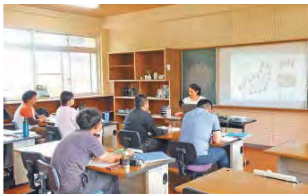
農産加工販売科の授業中の様子。受けに来る方の年齢は様々で、県外から通う人も。