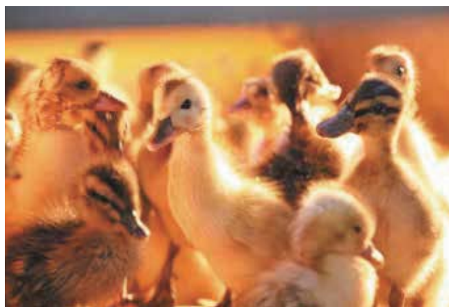
薩摩鴨の雛。この状態になってから農家に引き渡し、大きくなったら水田に放たれ、虫や雑草を食べる。