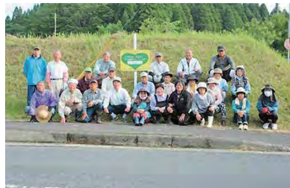
道路清掃を行った吉ヶ谷村づくり会の皆さん

5月15日、吉ヶ谷村づくり（財部町）の皆さんが県道都城隼人線（5km弱）の清掃活動を行いました。今回で6年目となるこの活動は、鹿児島県が進める「ふるさと道サポーター推進事業」の一環で、同会が年に3回（5月、7月、8月）実施しているものです。 当日は25名が参加。ビーパーで草を払ったりゴミ拾いなどを行いました。 作業を終え「車で通る人に曾於市の道路はきれいだねと言ってもらえるように頑張りました」と汗を拭いながら話しました。