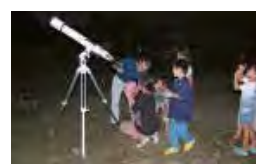
光神小：親子星空観測会