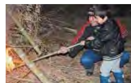
菅牟田小：鬼火たき