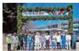
末吉中：緑門づくり