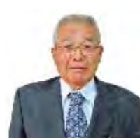
柳迫校区 福岡 勝