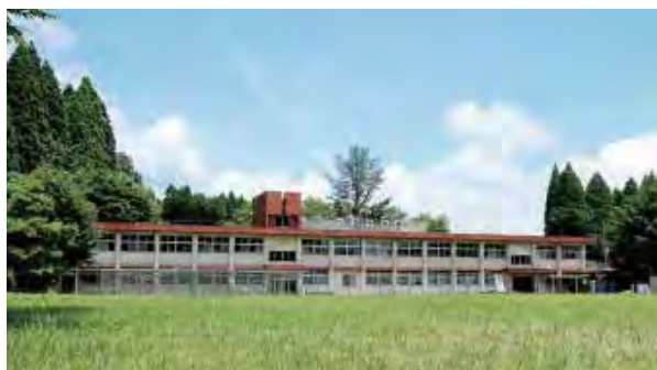
学校では座学や調理実習を行っている。農業訓練のための畑も学校からすぐのところであり、地域との交流も多い。

他にも、今年も恋活イベントをやりますし、お化け屋敷をやるうとか色々あります。うちの会社って何の会社だっけってスタッフは思ってるんじゃないですか(笑) だけど、うちは「ホームページ制作会社」じゃなくて、「企画として、ホームページを使う会社」なので、提供するサービスの真ん中には企画があるんです。 これから地域の交流の場として、どんどん発展をしていきたいと思っていますので、よろしく願います！