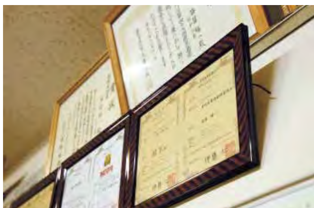
創業当時から目標であった特許も、今では23保持している。現在申請中のものもあり、次々と開発を進めている。