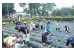
諏訪小：芋植え体験