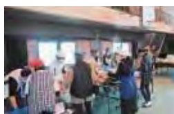
恒吉小：そば打ち体験