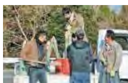
大隅南小：門松づくり