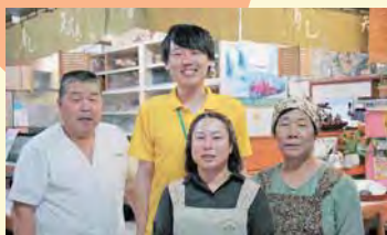
家族の一員になったような 気持ちになるお店です!