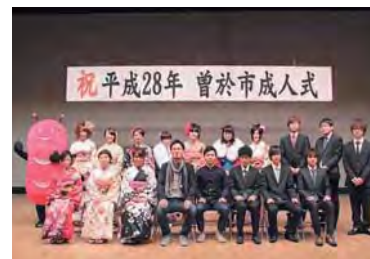
平成28年の成人式実行委員