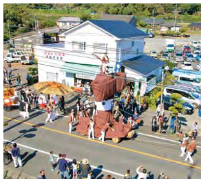
市街地を練り歩く弥五郎どん