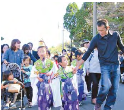
美しい衣装に身をまとった稚児行列

今年も秋の風物詩「岩川八幡神社の弥五郎どん祭り」が11月3日、岩川八幡神社を中心に盛大に開催されました。 弥五郎どんは隼人族の酋長あるいは武内宿弥の化身とも言われています。昭和63年には、鹿児島県無形民俗文化財に指定され、民俗学的な価値も高く評価されており、毎年多くの観衆が訪れます。 当日は、午前1時の「弥五郎どんが起きつど」のふれ太鼓を合図に祭りがスタートしました。1年ぶりに目さめる弥五郎どんを一目見ようと、深夜にもかかわらず境内は多くの参拝客で賑わいました。 祭りのメインは、午後1時から「弥五郎どんの浜下り」。子どもたちに引かれた弥五郎どんが鳥居をくぐり登場すると、大勢の観衆から大歓声があがりました。 巨体を揺らしながら、悠々と市街地を練り歩く弥五郎どん。その姿は岩川の町に秋の訪れを告げていました。