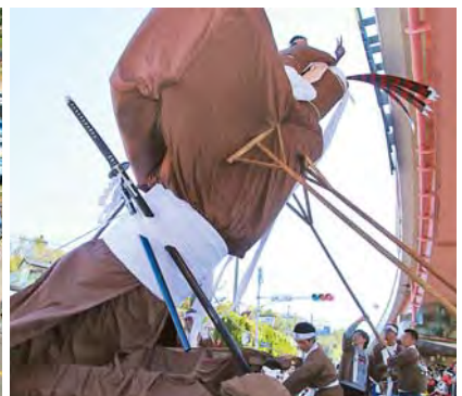
弥五郎どん祭り名物イナバウアー