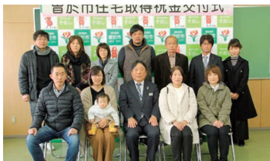
1月23日に行われた交付式

平成29年10月27日と平成30年1月23日に市役所本庁で住宅取得祝金の贈呈式が行われました。市では、住宅を新築または購入された方にお祝いとして、現金と地域商品券を支給しています。市外から転入して1年以内の方には、左記祝金に商品券5万円分と現金5万円が加算されます。詳しくは、本庁企画課定住推進係（☎0986-76-8802）までお問い合わせください。 対象 ・市内に居住するため住宅を新築または購入した方 ・市内業者による新築 商品券10万円分と現金10万円 ・市外業者による新築 商品券5万円分と現金5万円 ・未入居の建売住宅購入 商品券5万円分と現金5万円 ・右記以外の中古住宅購入 商品券2万5千円分と現金2万5千円