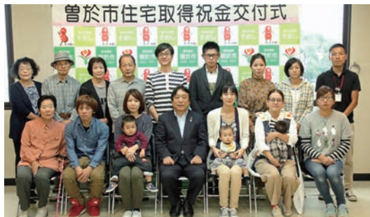
10月27日に行われた交付式