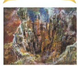
想いⅢ 鷗木 ひろ子(霧島市)