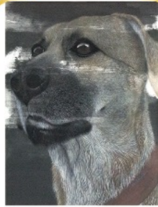
君は何を想う 2020-IV 千足 みえ(鹿屋市)