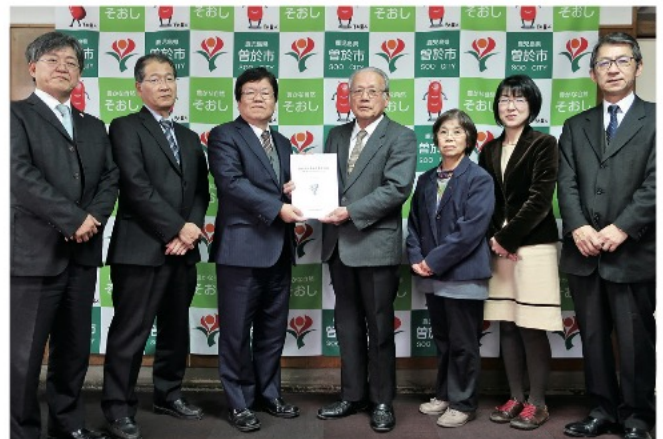
審議会から教育委員会へ答申書提出のようす

この計画は市の教育の基本となるもので、令和2年度から10年間の計画を策定します。審議会では教育委員会からの諮問に基づき、3回にわたって審議が行われました。計画の概要は4月以降にホームページに掲載する予定です。