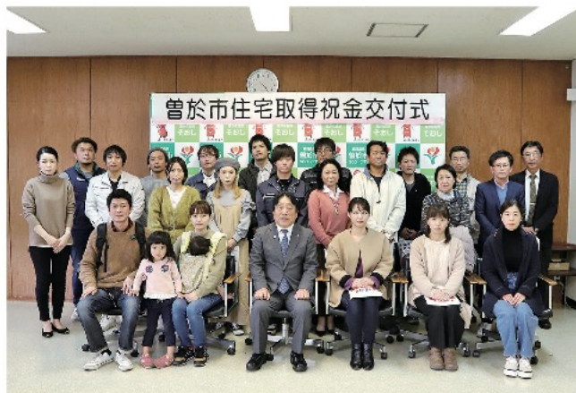
交付式に参加された皆さん

また、市外から転入して1年以内の方には祝い金に現金5万円と商品券5万円分が加算されます。今回は全体で31世帯（うち転入は13世帯）の方へ支給されました。