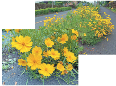
きれいな見た目ですが駆除対象です！ 持ち帰って育ててはいけません。