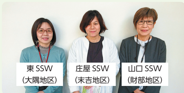
東 SSW (大隅地区)