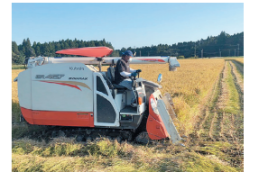
稲刈り（コンバイン）