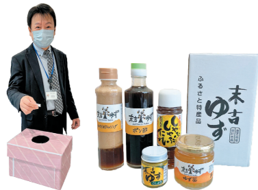
抽選写真 ゆず製品セット

健康づくりポイント事業とは健康のための行動を促し、習慣づけることを目的とした事業です。健康診断の受診・運動・血圧測定などを行うことでポイントが貯まり、合計15ポイント以上で応募できます。令和5年度の事業は2月9日に締め切れ、保健課長による特賞商品の抽選が行われました。その結果、豪華1万円相当のお肉の詰め合わせやゆず製品セットなど81名が当選しました。また先着150名様には市内温泉施設やプール・トレーニング施設の1回無料券をお渡ししました。令和6年度も開催予定ですのでご応募をお待ちしております。