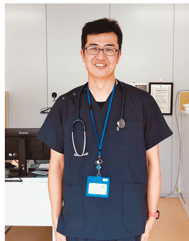
鹿児島大学共同獣医学部附属 南九州畜産獣医学教育研究センター

スクラブで飼養されている牛・馬の診療や学生の臨床実習を担当しています。今年4月のオープン以降、鹿児島大学共同獣医学部生の参加型臨床実習の一環としてスクラブを利用してきました。8月からは全国の獣医学部の学生を対象とした臨床実習が本格的に始まります。牛・馬・鶏・豚を総合的に学ぶコースや牛・馬・家畜衛生をそれぞれ専門に学ぶコースなど1週間のカリキュラムを用意しています。学生は併設する宿泊施設に宿泊します。今後は獣医師の卒後教育なども実施していく予定です。全国的に産業動物獣医師が不足している昨今、1人でも多くの学生に産業動物獣医師を目指してもらえように尽力したいと思います。