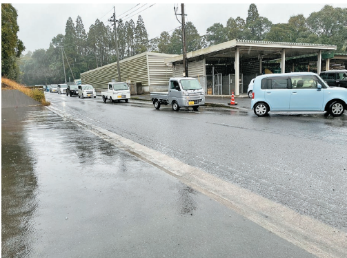
混雑時のクリーンセンター