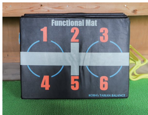
体幹やバランス能力を高めるファンクショナルマットを使用し、 KOBa 式体幹☆バランストレーニングを行う