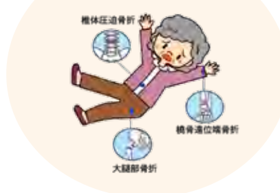
骨折しやすい部位

骨粗しょう症による骨折を防ぐためにも、定期的に 骨粗しょう症検診 を受けて、自分の骨の状態を知るようにしましょう。市では女性の 骨粗しょう症検診の無料化 を行っています。この機会にぜひ受診してください。