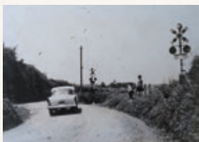
高見堂の踏切(昭和30年代)