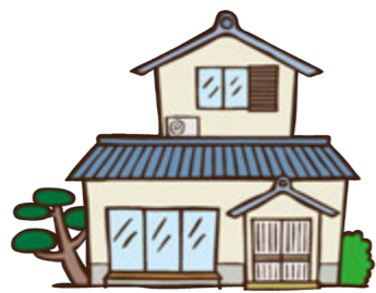
補助率と補助上限

地震による木造住宅の倒壊などの被害を防ぎ、安全な建築物の整備を促進するため耐震診断および耐震改修工事の費用に予算の範囲内で補助金を交付します。 補助要件 ・耐震診断・改修を行う木造住宅の居住者または所有者であること ・木造の専用住宅・長屋または共同住宅であること ・地上階数が2以下で、延べ面積が500平方メートル以下であること ・昭和56年5月31日以前に着工された木造住宅であること ・住居として使用されていること ・または住居として使用することが見込まれること 補助棟数 ・耐震診断1棟 ・耐震改修工事1棟 申請期間 随時受付 ※予算に到達した時点で終了