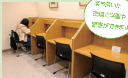
落ち着いた環境で学習や読書ができます