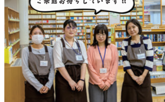
図書館館長(右2)と職員の方