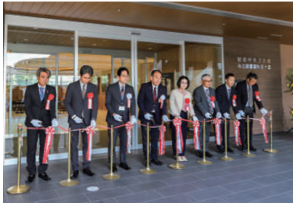
5月1日に図書館財部分館のオープニングセレモニーが行われました

新たな財部中央公民館と市立図書館財部分館が5月1日から開館しました。読書の場所としてだけでなく、学び、交流し、地域をつなぐ新しい拠点として期待されています。木のぬくもりを感じられる空間や、子どもから高齢者まで利用しやすい環境が整えられ、多くの人が気軽に集える場所となっています。令和7年5月には市立図書館大隅分館も開館し「本に親しむまち」として広がっていく機運が高まっています。図書館を通じた新たな出会いや学びが生まれ、地域のにぎわいや交流の輪がさらに広がることも期待されます。今回は新しい図書館の魅力を紹介します。