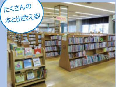
たくさんの本と出会える!