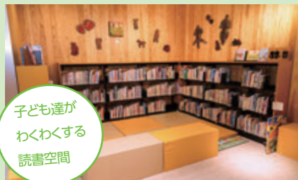
子ども達がわくわくする読書空間