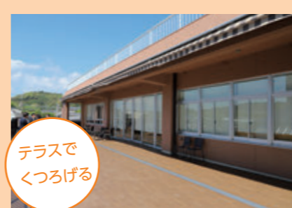
テラスでくつろげる