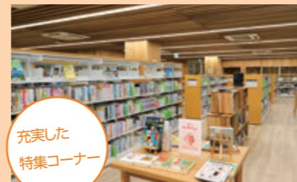
充実した特集コーナー