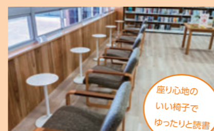
座り心地のいい椅子でゆったりと読書