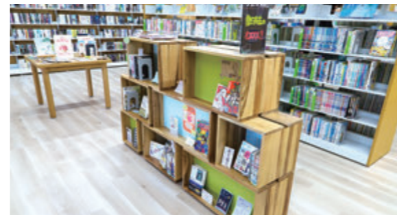
曾於高校生が本を選んだ特集コーナー

本を読むとなると少しハードルが高く感じる方もいると思うので、まずは気軽に図書館へ足を運び、雰囲気を感じてもらえたら嬉しいです。私達職員も皆さんに喜んでもらえるような本を選んでいきます。