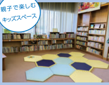
親子で楽しむキッズスペース

【アクセス】 末吉町二之方2019 ☎ 0986-28-8051 【休館日】 ・毎週月曜日、毎月第3水曜日、年末年始(12月28日～1月4日) ※月曜日が祝日の場合は翌平日